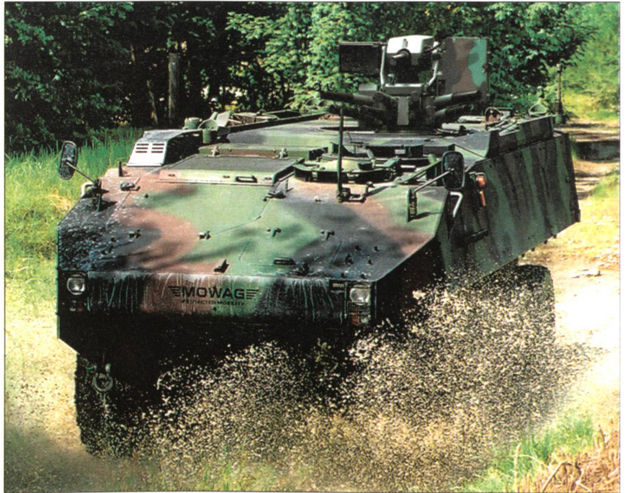
Der Piranha III C könnte nicht mehr nach Belgien ausgeführt werden.

Mit dem Bundesratsentscheid vom 11. Mai 2005 wird die Verteidigungsfähigkeit der Schweizer Armee auf wenige Aufwuchskerne reduziert. Bei einer Veränderung der sicherheitspolitischen Lage müsste die Armee «aufwachsen», z.B. in Bezug auf Ausrüstung, Bewaffnung, Dienstleistungsdauer und Verteidigungsbudget. Eine Conditio sine qua non für das Funktionieren dieses z.T. bestrittenen Aufwuchskonzepts ist die Erhaltung einer ausreichenden schweizerischen Industriebasis mit dem entsprechenden technologischen Know-how. Mit einem Ausfuhrverbot würde der Rüstungsindustrie die Existenzgrundlage entzogen, nachdem die Schweizer Armee um zwei Drittel geschrumpft ist. Das Aufwuchskonzept und damit die Grundlage der militärischen Landesverteidigung wäre fundamental gefährdet. Dies kann die AWM unter keinen Umständen akzeptieren.