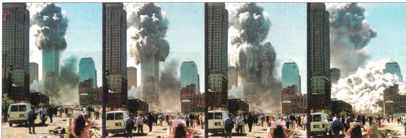
Zusammenbruch: Eine Stunde später kollabiert der Turm. Nach 8 Sekunden ist das Gebäude zur Hälfte eingestürzt (Bild 2), 5 Sekunden später steht nur noch das untere Drittel (Bild 3). Nach weiteren 31 Sekunden (Bild 4) ist alles vorbei.

1980 begab sich Abdullah Azzam (1949–1989), ein palästinensischer Muslimbruder, nach Pakistan und baute das Netzwerk zur Unterstützung der Mujaheddin in Afghanistan mit Geld und arabischen Freiwilligen auf. Seine von ihm entwickelte Lehre basierte auf denjenigen vom Qutb, al-Banna und Maududi. Auf bin Laden und die arabischen Afghanistan-Kämpfer übte sie einen starken Einfluss aus.