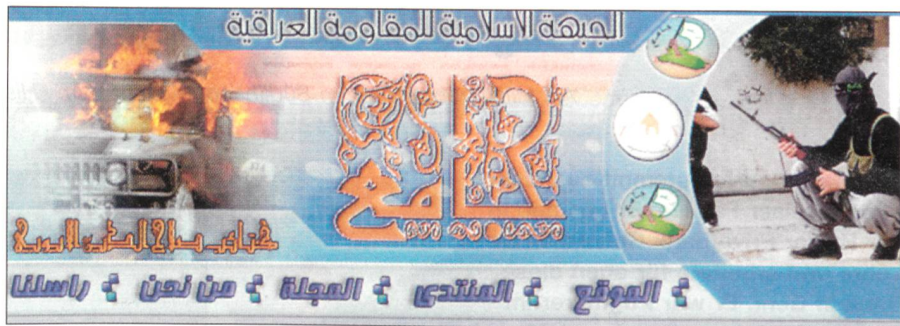
Webseite einer islamistischen Gruppierung im Irak.

Im Zuge des Kampfes gegen den Terrorismus, den die USA ab 2001 entschlossen führt, wurden viele der engen Vertrauten von bin Laden verhaftet oder getötet. Bin Laden und dessen Stellvertreter Zawahiri sind inzwischen isoliert und haben massiv an Einfluss verloren, da sie sich nicht mehr frei bewegen können. Ihre Aktivitäten beschränken sich heute auf die Abgabe von Erklärungen und den Informationsaustausch mit anderen Terrorgruppen. Über ihren Aufenthaltsort kann nur spekuliert werden. Vermutlich halten sie sich im pakistanisch-afghanischen Grenzgebiet auf.