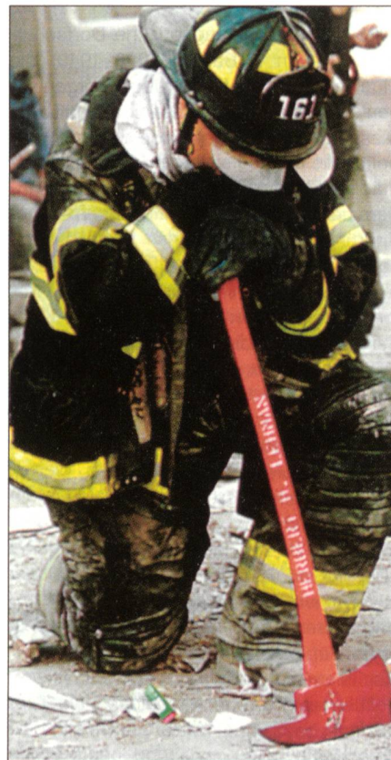
Fassungslos: Der Feuerwehrmann sah, wie das World Trade Center zusammensackte.

Als Reaktion auf die Botschaftsanschläge ordnete Präsident Clinton, durch die Lewinsky-Affäre geschwächt, einen Angriff mit 80 Tomahawk-Cruise-Missiles auf eine Pharmaziefabrik im Sudan, in welcher irrtümlicherweise die Herstellung von Giftgasen vermutet wurde, sowie sechs Trainingslager in Afghanistan an. Diese Raketenangriffe bewirkten allerdings das Gegenteil dessen, was die USA mit ihnen bezweckte. Statt die Terroristen abzuschrecken, steigerten sie die Bekanntheit und