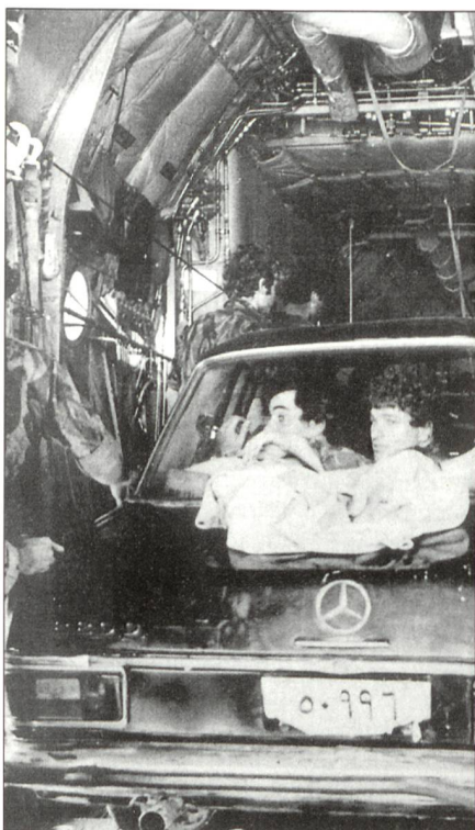
3./4. Juli 1976: Der schwarze Mercedes, mit dem der israelische Stosstrupp in Entebbe die ugandischen Wachtsoldaten täuschte.

Beide Forderungen werden erfüllt, und nach sieben Stunden am Boden fliegt die Air-France-Maschine mit vorerst unbekanntem Ziel weiter. Von einer ersten frei-