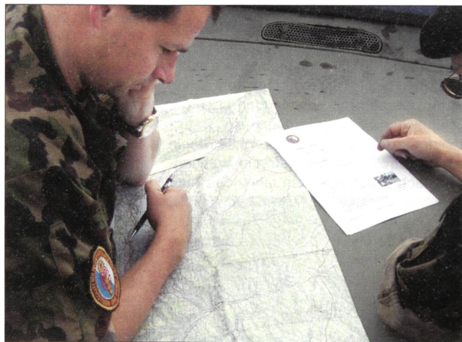
Auch Kartenlesen will gelernt sein.

Die Veranstaltung wird im Auftrag des Verbandes Schweizerischer Militär-Motorfahrer Vereine (VSMMMV) und in Zusammen-