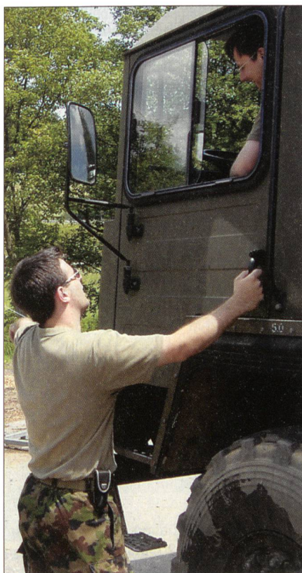
Motorfahrer arbeiten präzise.