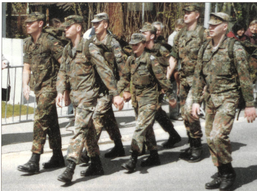
Am Ziel nach 40 Kilometern: Gäste aus Deutschland.

Bereits zum fünften Mal waren Ausgangspunkt und Ziel in Belp bei Bern. Die Zahl der Teilnehmerinnen und Teilnehmer konnte mit rund 3000 gegenüber dem Vorjahr gehalten werden. Alle, die nach Belp