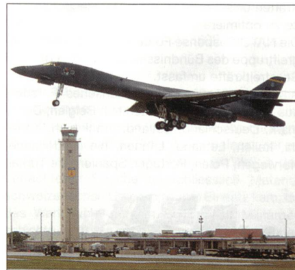
Bomber B-1B der US-Air Force.

Das US-Verteidigungsministerium wird noch in diesem Jahr mit der Arbeit für Bomberflugzeuge mit grosser Reichweite der nächsten Generation beginnen. Dabei wird es seine Pläne für eine Modernisierung der Bomber fast um zwei Dekaden beschleunigen. Das soll den Zweck verfolgen, die Erweiterung der Effektivität der US-Luftstreitkräfte über die Asien-Pazifik-Region zu beschleunigen.