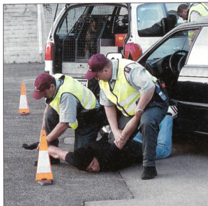
Eindrückliche Demonstration der Schaffhauser Grenzwächter, hier bei der Verhaftung eines «Täters».