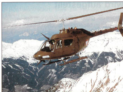
OH-58 «Kiowa» im Hochgebirge.

Das österreichische Bundesheer schulte 20 eigene und ausländische Hubschrauberpiloten im Gebirgsfliegen. Vom 17. bis 22. März trainierten die Soldaten in der Obersteiermark, am Fliegerhorst Fiala-Fernbrugg, in Aigen im Ennstal und in Hochgebirgsregionen. Sieben der Teilnehmer kamen in diesem Jahr von der Heeresfliegerschule der deutschen Bundeswehr.