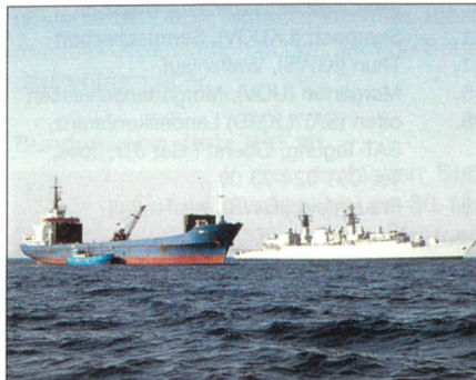
Schiffe bei «Active Endeavour».

Die im Mittelmeer geführte NATO-Operation gegen Terroristen «Active Endeavour» (Aktives Bemühen) wird als sehr positiv gesehen. Vor kurzem hatte man den hundertsten Einsatz an Bord eines verdächtigen Schiffes durchgeführt. Für dieses sensitivste und schiffreichste Gebiet ist das nach NATO-Ansicht ein signifikanter Meilenstein für die Organisation.