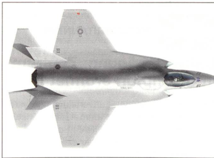
F-35B «Joint Strike Fighter».

Die Entscheidung über die Beschaffung des JSF wird eine parlamentarische in den einzelnen Staaten sein. Substanzuelle Interessen sind jedoch dabei eingebunden, weil das Gesamtvorhaben die nächsten 30 bis 40 Jahre umschliessen wird. Das betrifft nicht nur die europäische Kooperation auf dem Gebiet der operationellen