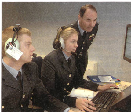
Britische Soldaten im neuen Luftverteidigungszentrum auf dem Stützpunkt in Scampton.

Das neue britische Luftverteidigungssystem macht Fortschritte. Auf dem Luftwaffenstützpunkt der Royal Air Force (RAF) Scampton, Lincolnshire, wurde Ende Januar ein neues datenvernetztes «Control and Reporting Centre» (CRC) eröffnet.