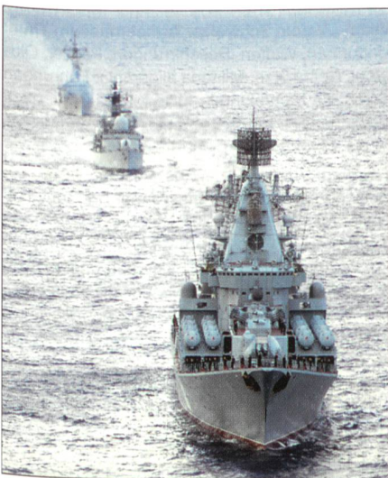
«RFS Moskva» und NATO-Schiffe.

Ein fünf Mann starkes NATO-Team ging am 5. Februar in Sevastopol (Ukraine) an Bord des russischen Kreuzers «Moskva». Das Ziel war die Vorbereitung der russischen Schiffseinheit auf den Eintritt in die Terrorbekämpfungsaktion der NATO und die Verbesserung der Interoperabilität zwischen NATO und russischen Schiffen. Die NATO-Leute koordinierten aber auch die Ausbildung des Personals des Hauptquartiers der russischen Schwarzmeerflotte und das jener Schif-