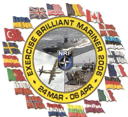
Logo von «Brilliant Mariner 2006».

An der Übung nahmen militärisches Personal aus siebzehn NATO-Staaten teil: Belgien, Dänemark, Deutschland, Estland, Frankreich, Kanada, Italien, Lettland, Litauen, die Niederlande, Norwegen, Polen, Portugal, Spanien, die Türkei,