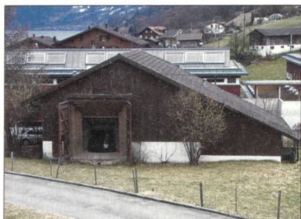
Hinter dem Scheunentor verbirgt sich eine 10,5-cm-Kanone.

tige Alpentransversale, die Lötschberg-Bahnachse, unter Feuer genommen werden. Die Geschützstellungen sind durch Stollen miteinander verbunden.