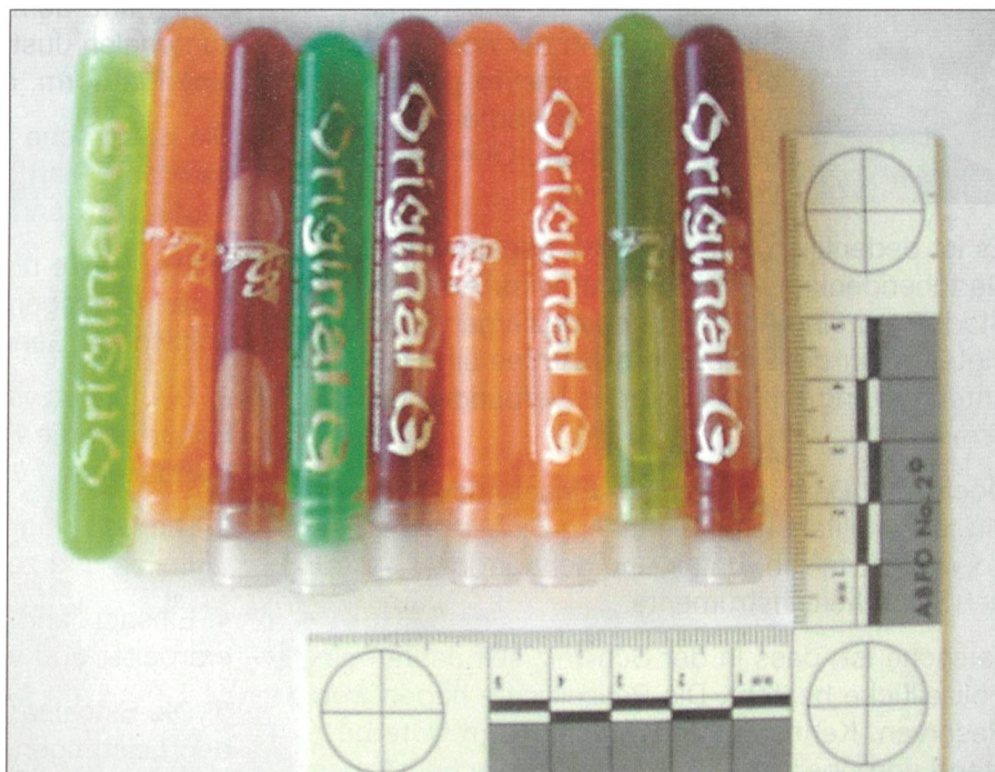
Drogenhandel: Gammahydroxybutyrat (GBH) wird in der Szene auch «Liquid Ecstasy» genannt, ist aber mit diesem chemisch nicht verwandt.

Unsere nationale Sicherheit ist geprägt durch die oben erwähnten Herausforde-