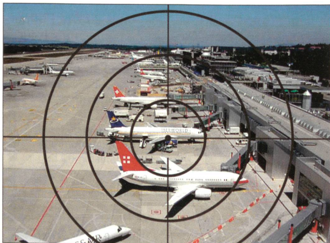
Der Luftverkehr im Visier des Terrors.

Was tut unsere Armee in dieser Lage? Sie bemüht sich um die zum Teil noch gravierenden Mängel der letzten Reorganisation («Armee XXI»), insbesondere auf dem Gebiet der Ausbildung und des Personellen. Umfangreiche und dringende Garantearbeiten müssen noch vollendet werden. Das