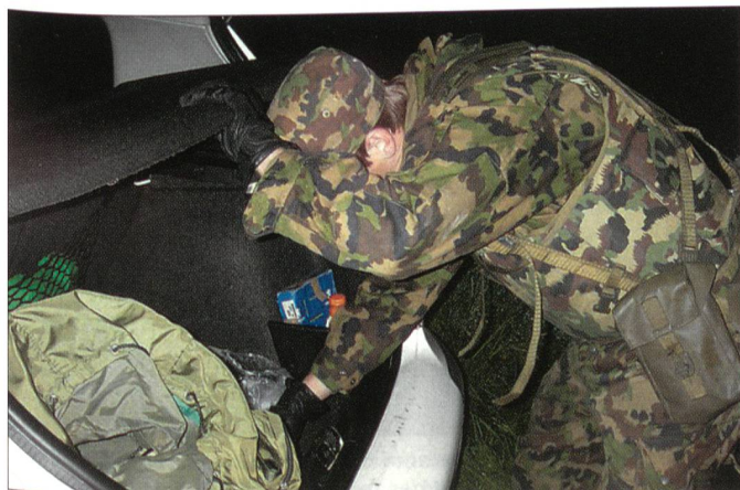
Fahrzeugkontrolle in Hauterive.