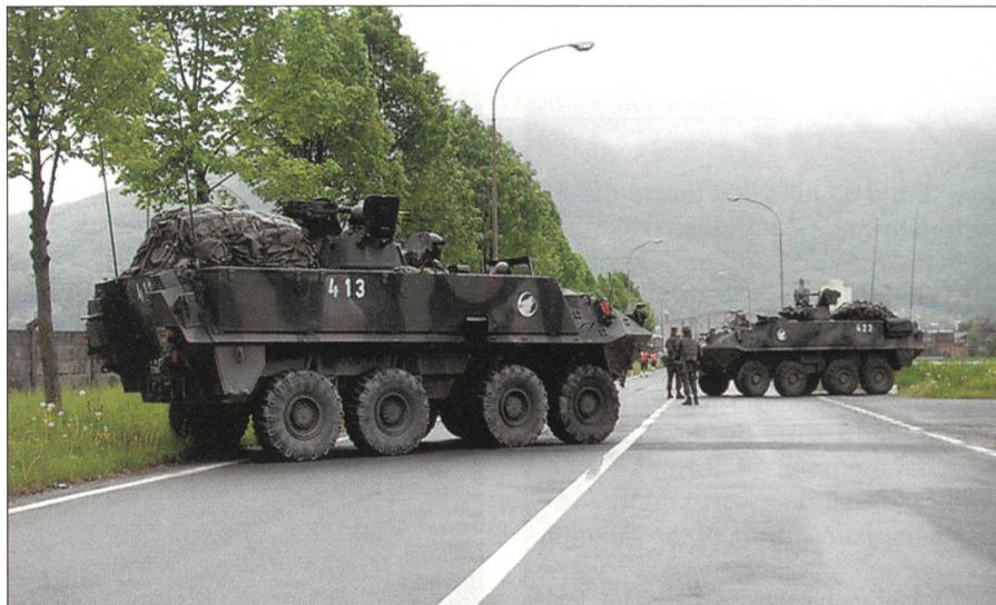
Radschützenpanzer in Collombey (VS).

Einige Sorgen machte sich noch der Quartiermeister des Bataillons, Hptm Roth. Er musste die Art der Mittagsverpflegung bei den Kompanien an diesem ersten Übungstag wohl dem Einfallreichtum der jeweiligen Fouriere überlassen, da Kampfportionen, durch die LBA bzw. das Mob Log Bat 52 erst am Abend nach 18 Uhr geliefert würden. Um 11.15 Uhr war es dann so weit: von der Brigade kam das GO. Als die Stabsangehörigen des Inf Bat 13 die Mezzener Kaserne in Bern verliessen, begann es wie aus Kübeln zu giessen.