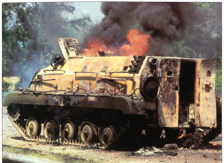
Kampfszene aus dem serbisch-kroatischen Krieg.

Belgrad verspricht, dass es die Banden liquidieren werde. Otto von Habsburg, nennt es «Naivität», wenn man daran glaube, denn «die serbische Polizei ist noch immer durchsetzt von Kriminellen dieser Gangs ... Mit anderen Worten: Es besteht weiter die gleiche Struktur, wie seinerzeit in den Tagen von Miloševic.» Das hat auch der serbische Exregierungschef Zoran Zivkovic im November des Jahres 2004 festgestellt: Die Republik Serbien werde im Hintergrund von Gefolgsleuten des früheren jugoslawischen Präsidenten Slobodan Miloševic beherrscht. Otto von Habsburg weist aber auch auf den früheren Präsidenten von Jugoslawien und heutigen Regierungschef von Serbien, Vojislav Koštunica, hin. Dieser habe vor vier Jahren erklärt, dass er mit fast allen