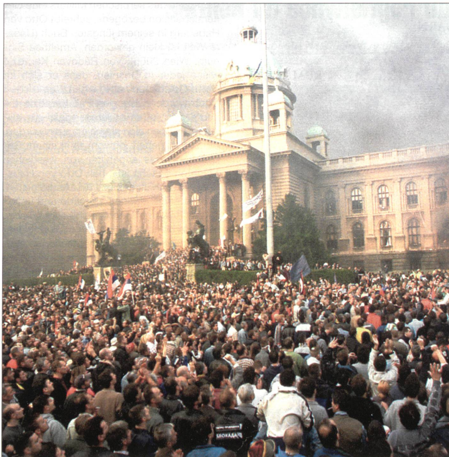
Oktober 2000: Der Sturm auf das Parlament in Belgrad.

Punkten des Programms von Milošević einverstanden sei, aber dass er ihn darum nicht mehr unterstütze, weil er den Krieg verloren hat. Habsburg sieht ebenfalls Koštunicas Handlungsfähigkeit begrenzt: «Jedermann in Belgrad weiss, dass er, falls er versuchen sollte, die Allianz mit den kriminellen Banden zu lösen, innerhalb von kurzer Zeit tot wäre.»