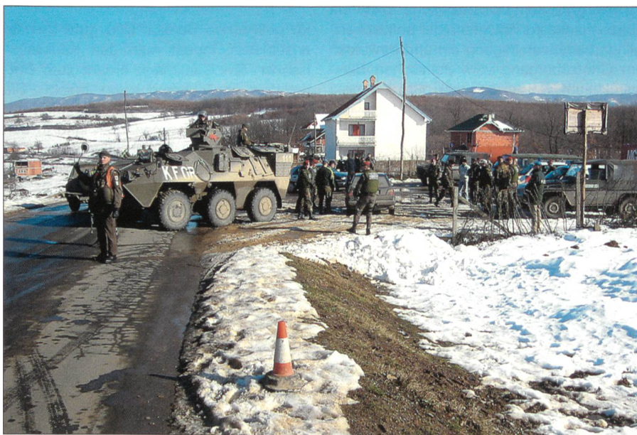
Im Kosovo sorgt die KFOR-Friedenstruppe für Ordnung.

Am 12. März 2003 wurde der damalige Ministerpräsident Zoran Djindjic, ein Hoffnungsträger des Westens, vor seinem Amtssitz erschossen. Für die Ermittlungsbehörden galten Milorad Lukovic («Legia») und Dusan Spasojevic, Führer einer nach einem Belgrader Vorort Zemun benannten kriminellen Gruppierung, als Drahtzieher des Attentats. Lukovic war bis 2001 Kommandant der 1991 vom Geheimdienst auf-