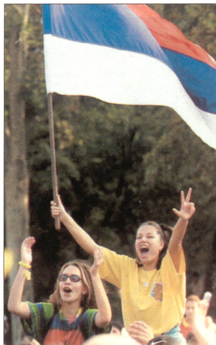
Jubel nach dem Sturz von Milošević.

als eigentliche Geburtshelferin der Union schwenkt nun auf die neue Linie ein. Die Union Serbien-Montenegro wurde als Rechtsnachfolgerin Jugoslawiens aus der Taufe gehoben, weil Brüssel die weitere Aufspaltung der Staaten in Südosteuropa