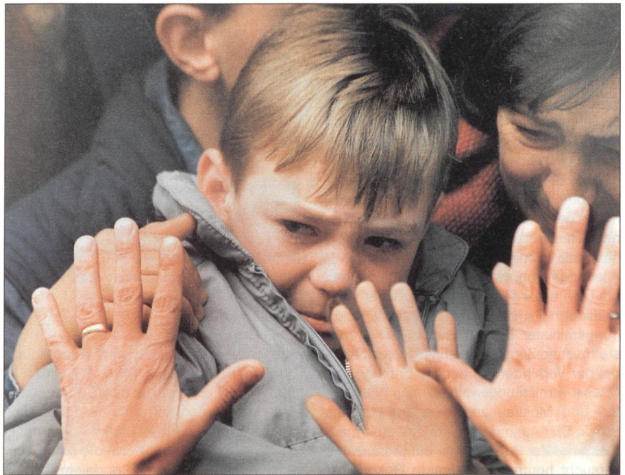
Sarajevo, während der serbischen Belagerung: Ein Knabe nimmt Abschied von den Eltern.

Auf dem Gebiet der EU-Annäherung gibt es zumindest starke Verzögerungen. Vor einem Jahr bescheinigte die EU-Kommission, dass die politischen und wirtschaftli-