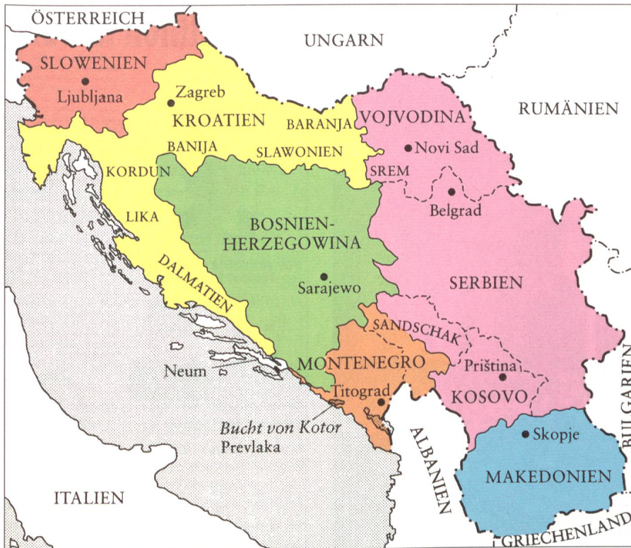
Jugoslawien 1991: Seither wurden Slowenien, Kroatien, Bosnien-Herzegowina, Mazedonien und Montenegro unabhängig.

gebauten Sonderpolizeitruppe JLO («Rote Barette»). Die JLO, damals etwa 350 Personen stark, wurde am 25. März 2003 aufgelöst. Sie steht im Verdacht, auch mehrere andere Morde (z.B. an Expräsident Ivan Stambulic) und Anschläge (z.B. auf Vuk Draskovic) begangen zu haben. Bereits der Mord am serbischen Ministerpräsidenten Zoran Djindjic offenbarte die enge Verflechtung von Staats- und Justizorganen mit der Organisierten Kriminalität. Schon früher gab es geheime Gemeinschaften und eine Tradition des Bandenwesens. Man erinnere sich nur an den Tschetnik-Führer Arkan, der vor seiner Ermordung über grosse Gebiete Serbiens und serbisch okkupierte Gebiete Kroatiens herrschte. Aber auch nach dem Sturz von Slobodan Miloševic sind die mafiosen und korrupten Strukturen erhalten geblieben und noch immer stark präsent. Nach der Ermordung von Ministerpräsident Zoran Djindjic verlor die Regierungskoalition zunehmend an Rückhalt und musste Ende 2003 schliesslich vorgezogene Neuwahlen ausrufen. Die Anfang März 2004 gebildete Minderheitsregierung unter Ministerpräsident Koštunica sieht sich mit Reformproblemen v.a. im Bereich Wirtschaft und Verwaltung konfrontiert. Aber nicht nur damit.