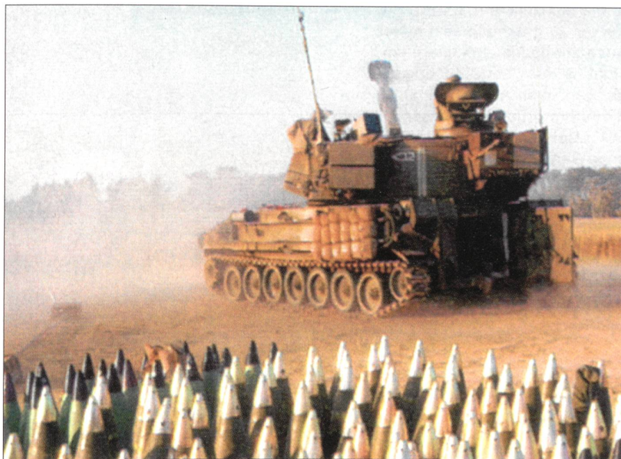
Israelisches 155-Millimeter-Geschütz in der Feuerstellung vor Gaza.

Die israelische Luftwaffe setzte F-16-Kampfflugzeuge, Cobra- und Apache-Helikopter ein. Gezielt wurden im Gaza-