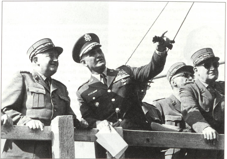
Anlässlich des Besuchs von William C. Westmoreland, Generalstabschef der US-Streitkräfte, leitete Brigadier Jeanmaire (links) eine Demonstration. Rechts im Bild Generalstabschef Paul Gygli. Der Besuch fand vom 11. bis 14. September 1969 statt.