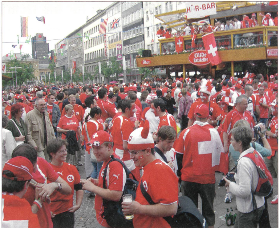
Schweizer Fussballanhänger in Deutschland.

Führungsverantwortung: «Ausübung der Kommandogewalt mit dem Ziel, die Einsatzbereitschaft in allen Bereichen zu wahren. Ziel ist es, die bestmögliche Verbandsleistung im Sinne des Auftraggebers zu erreichen.»