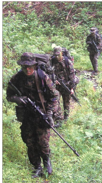
Scharfschützentrupp in Aktion.

Die Annäherung stellt die letzte, gedeckte Verschiebung in die Stellung dar, welche grundsätzlich zu Fuss stattfindet. Zeit und