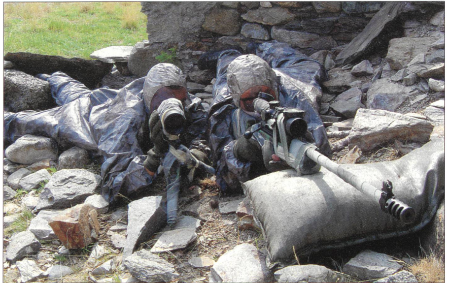
Scharfschützen in Sniperstellung.

Mit dem Binom Beobachter/Schütze besteht die Möglichkeit, sowohl hinter den feindlichen Linien wie auch bei Checkpoints die Lage zu überwachen bzw. aufzuklären und bei Bedarf erkannte Bedrohungen und lohnenswerte Ziele schnell und präzise zu bekämpfen. Mit dem Wandel des Gefechtsfeldes von weiten Grünflächen zu überbautem Gebiet und dem Auftauchen von asymmetrischen Bedrohungen ohne bekannte militärische Struktur und Organisation, welche sich nur schwer vom zivilen Umfeld unterscheiden lassen, stellt der Scharfschütze auch hier