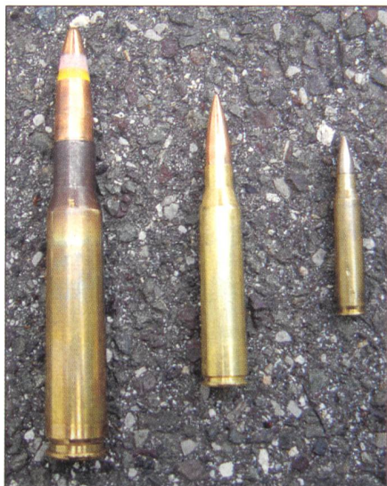
Größenvergleich Muniton (von links: .50 Browning, .338 Lapua Magnum, GP 90).

Herstellers SIMRAD Optronics, ist ein Restlichtverstärker der neuesten Generation und weltweit bei Scharfschützen im Einsatz.