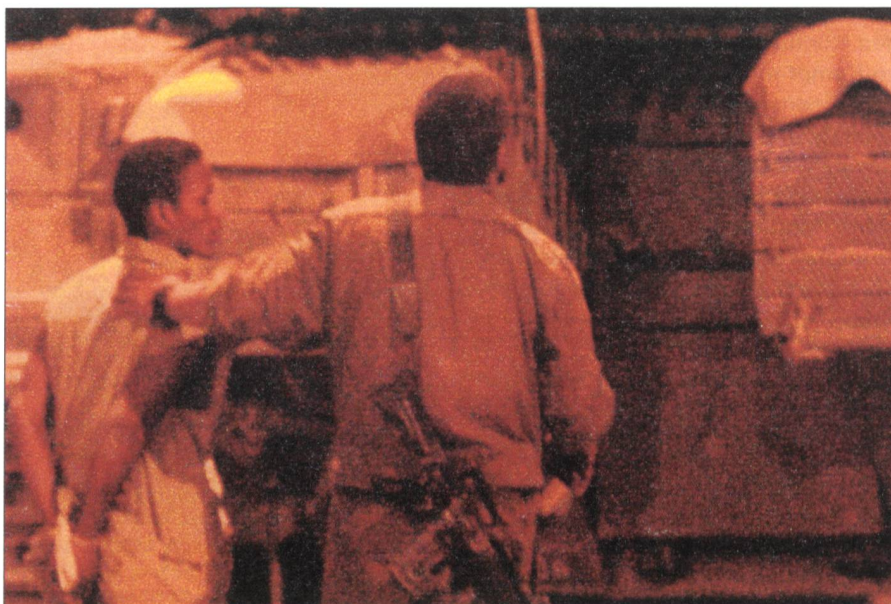
Soldaten nehmen einen mutmasslichen Hisbollah-Mann fest. Die Guerillakämpfer sind schwer zu fassen.

Das eigentliche Ziel der Operation war ein Gebäude in Baalbek: das von einer iranischen Pro-Hisbollah Organisation geführte Krankenhaus Dar al-Hikmah. Im Gebäude sollen sich keine Patienten befunden haben, da es einige Tage vor dem Angriff geräumt wurde.