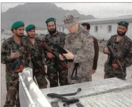
Ausbildung am Gewehr.

Die afghanischen Soldaten lernten, einen Checkpoint zu betreiben sowie Personenüberprüfungen und Patrouillen eigenständig durchzuführen. Auf Grund der unterschiedlichen Vorkenntnisse wurde jedoch zuerst bei den Grundfertigkeiten angefangen: z. B. mit dem Zerlegen und Zusammensetzen der eigenen Waffe, mit den verschiedenen Anschlagarten sowie mit dem Zielen mit der Waffe usw. Anschliessend daran folgte das eigentliche Thema: Schrittweise zeigte man den afghanischen Soldaten, wie