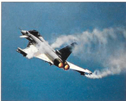
Eurofighter – das modernste Multi-role-Flugzeug Europas.

Sein Einsatzspektrum umfasst sowohl den Luftkampf über grosse Entfernungen und ausserhalb der Sichtweite (BVR) als auch den Nahkampf mit extremer Agilität. Zudem ist er bei jedem Wetter einsatzbereit, verfügt über Kurzstart- und -landefähigkeit, Supercruise, hohe Überlebensfähigkeit und Einsatzwirksamkeit sowie die Unabhängigkeit von externem Bodengerät.