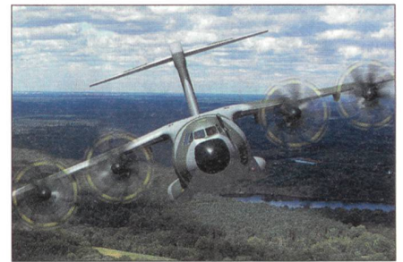
Airbus A-400M ab 2010.

Der A-400M ist eine europäische Gemeinschaftsentwicklung. Folgende Nationen werden insgesamt 180 Maschinen vom Typ A-400M erwerben: Deutschland 60; Belgien (zusammen mit Luxemburg) 8; Spanien 27; Frankreich 50;