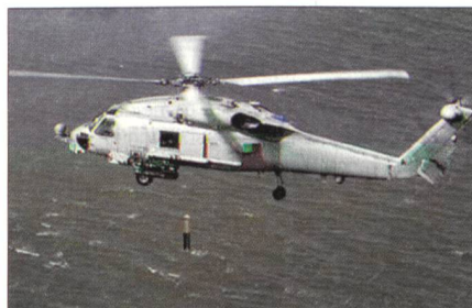
MH-60R für die Marine.

Damit wird dem Masterplan der US Marine im Bereich der Hubschrauber entsprochen, nachdem von sechs Hubschraubertypen auf zwei Multi-Missions-Hubschrauber, dem MH-60S