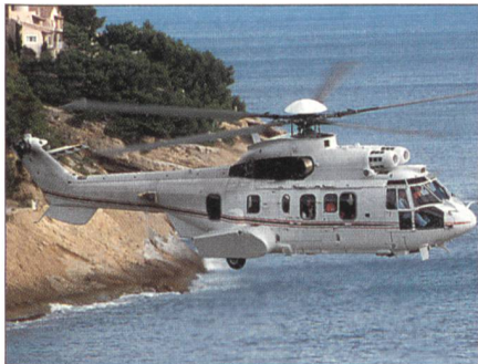
Hubschrauber EC 225-Bestellung.

Die VR Chinas hat vor wenigen Wochen zwei Hubschrauber vom Typ EC 225 bei Eurocopter bestellt. Diese Hubschrauber sollen für Such- und Rettungsflüge (SAR) eingesetzt werden. Die EC 225 ist das jüngste Mitglied in Eurocopters «Super-Puma»-Familie von zweimotorigen Hubschraubern der 10/11-Tonnen-Klasse. Der