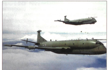
Zwei Aufklärungsflugzeuge «Nimrod» MR2.

Die Royal Air Force erhält 12 neue «Nimrod» MRA4-Flugzeuge. Diese Modelle sind äusserst fortgeschrittene Flugzeuge, ausgestattet mit den modernsten Navigations- und Aufklärungssystemen. Sie werden für weit reichende Aufklärungs- und U-Boot-Jagd-Einsätze sowie für Such- und Rettungsoperationen verwendet. Ihre Reichweite beträgt über 6000 Meilen und die Einsatzdauer über 15 Stunden.