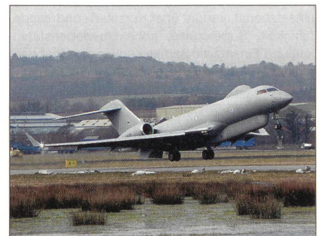
Sentinel R Mk.1-Flugzeuge.

Auf dem RAF-Stützpunkt Waddington, Lincolnshire, wartet man auf die fünf Sentinel R Mk.1-Flugzeuge. Diese werden auf der Basis des Zivillflugzeuges Bombardier Global Express stark modifiziert in Grossbritannien und in den USA hergestellt.