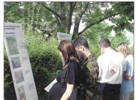
Knacknuss Mittelalter: Spannendes Quiz zum Thema «Wehrhaftes Zürich».