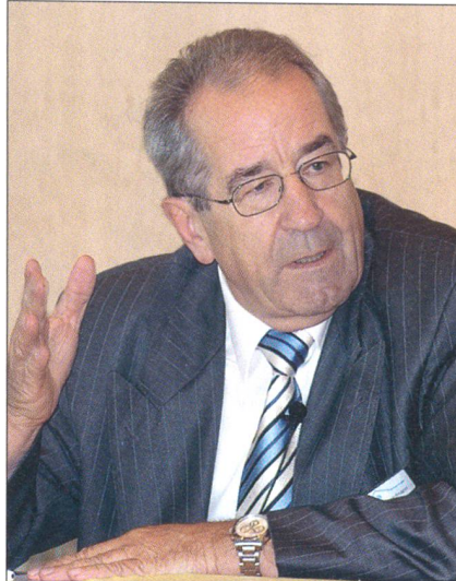
Hofmann: Vieles bleibt zu tun.

Der Sicherheitsausschuss des Bundesrates, bestehend aus den Spitzen des VBS, des EJPD und des EDA, sei gestärkt und mit einem Stab versehen worden. Ebenso hätten der SND und der DAP in ihrer Kooperation drei gemeinsame Plattformen