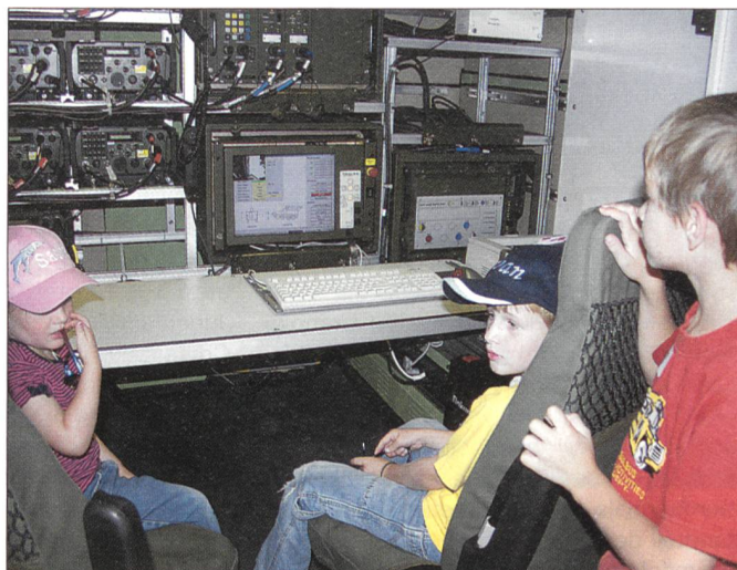
Auch Kinder sind von der Übermittlungstechnik fasziniert, vor allem der vielen farbigen Knöpfe und Schalter wegen.