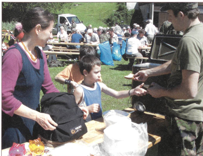
Der traditionelle Spatz schmeckt der ganzen Familie. Die Vorbereitungen durch die Küchenmannschaft dauerten eineinhalb Tage.