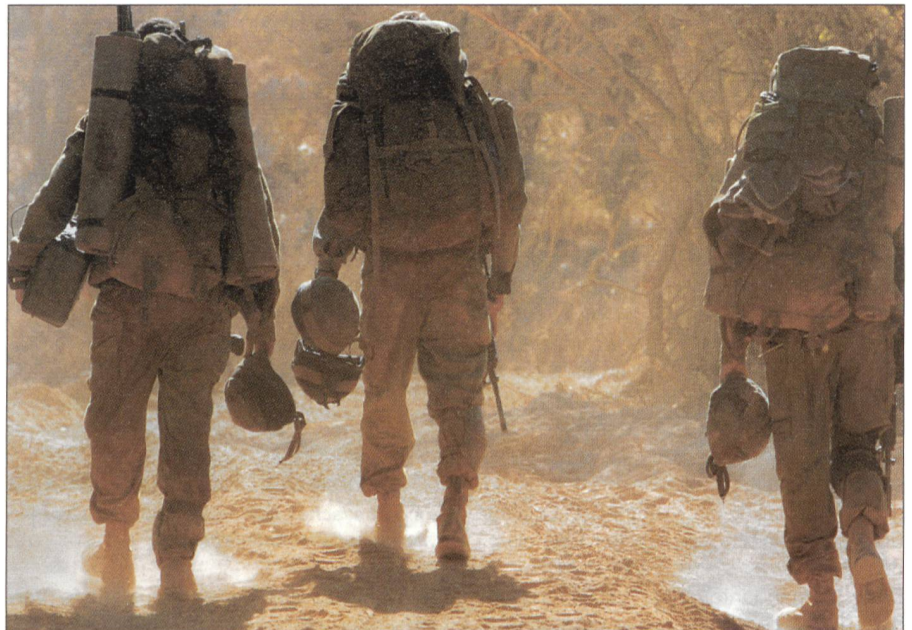
Israelische Soldaten marschieren über die Grenze – zum Kampf mit der Hisbollah.

Am Tag dirigierte uns das Feuer der Artillerie und der Luftwaffe. Sobald die Hisbollah Katjuscha-Werfer in Stellung brachte,