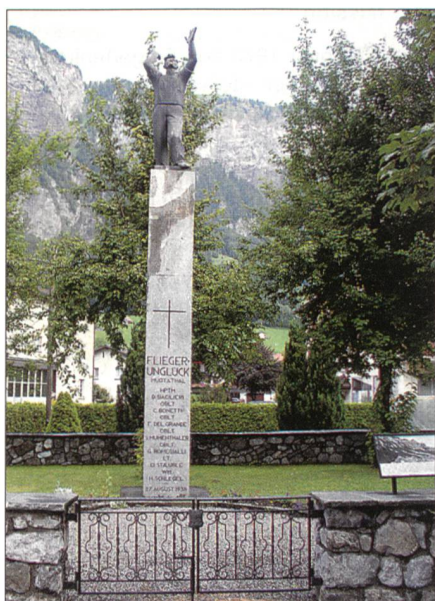
Noch heute erinnert mitten in Muotathal dieses Denkmal an das Unglück der Fliegerkompanie 10.

Hier die Darstellung des Ablaufs, wie ihn Werner Guldemann dem Untersuchungsrichter zu Protokoll gegeben hatte: «Um 15.50 Uhr nahm der Staffelführer ziemlich steigend eine Kurve nach rechts, wahr-