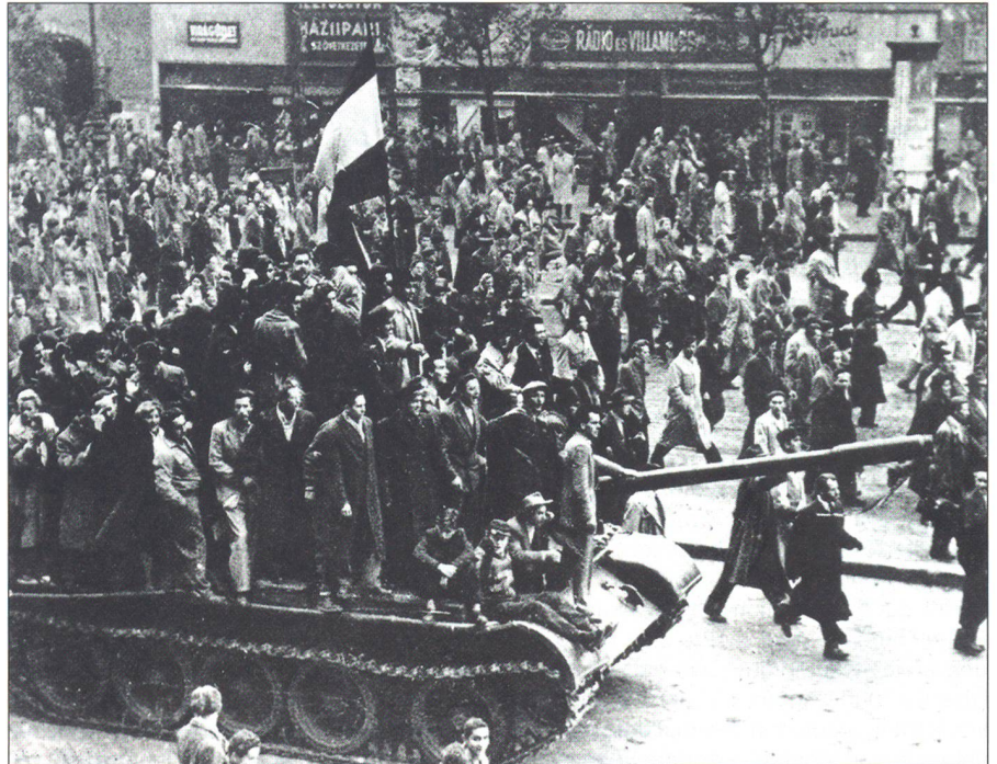
Ungarn erhebt sich – vergeblich.

Umso mehr erstaunt, wie wenig Aufmerksamkeit bei der Beurteilung damaliger Wahrscheinlichkeiten oftmals die Tatsache