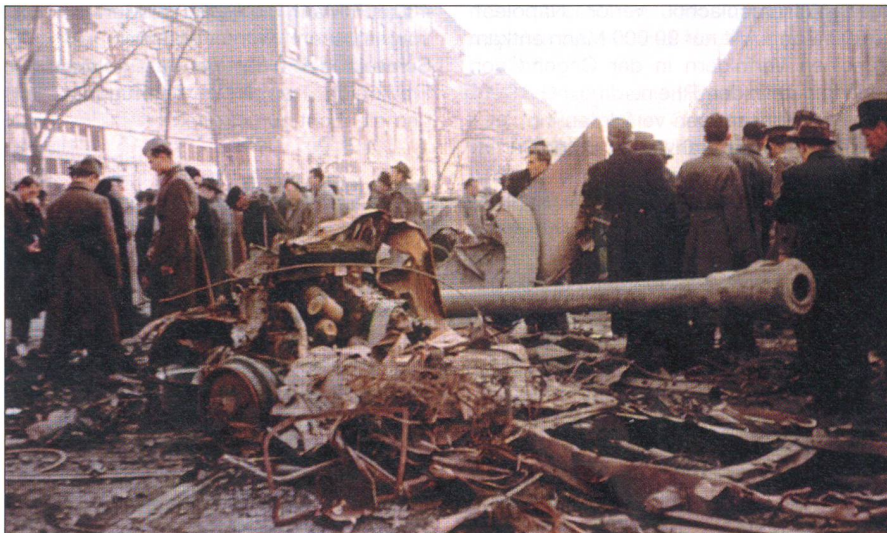
Zerstörte sowjetische Waffen in Budapest 1956.