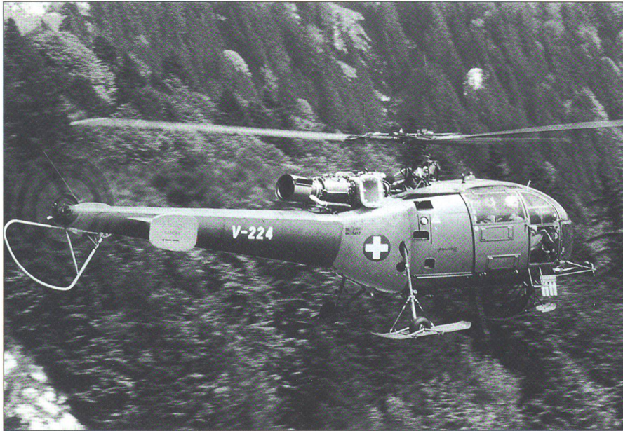
Erstmals wurden im Rahmen der TO 61 auch grössere Mengen an Helikoptern beschafft, sodass die Armee schliesslich über 100 Alouette II und Alouette III verfügte. Die Aufnahme zeigt eine französische Alouette III.

der Baubeginn der AMPs und Geländeverstärkungen im Grenzraum finanziert werden.