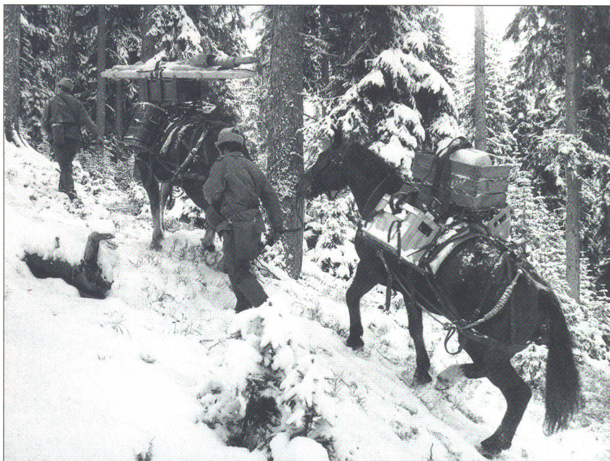
Pferde und Maultiere hatten auch in der TO 61 nach wie vor einen hohen Stellenwert, so verfügten die Gebirgsdivisionen über je eine Trainabteilung.