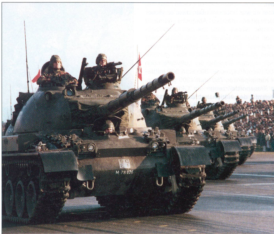
In grösserer Stückzahl wurden Kampfpanzer aus eigener Produktion beschafft, darunter Fahrzeuge der Typen Panzer 61, Panzer 68 und Panzer 86/88. Diese anlässlich des grossen Defilees in Dübendorf von 1986 gemachte Aufnahme zeigt Fahrzeuge des Typs Panzer 68.

Der mögliche Einsatz von taktischen Nuklearwaffen auf dem modernen Gefechtsfeld und die Gefahren einer vertikalen Um-