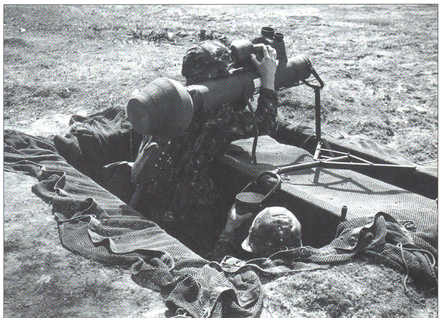
Im Verlaufe der Weiterentwicklung der TO 61 wurden namhafte Mengen an modernen Panzerabwehrlenk Waffen beschafft, darunter amerikanische Lenk Waffen der Typen TOW und – hier gezeigt – Dragon.

Dazu zählen etwa folgende Beispiele: 1972 beschlossen und 1974 erfolgte Abschaffung der Kavallerie – Umschulung zu Panzergrenadiern, ab 1971 Einführung der Mech Artillerie bis zu einem Bestand von insgesamt 31 Abteilungen mit gegen 560 Pz Hb M-109, 1977 erste Tranche von insgesamt 120 Tiger-F-5E -Kampfflugzeugen, 220 Kampfpanzer des Typs Pz 68, Panzer-