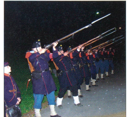
Gleich krachts: Die Compagnie 1861 schießt einen Ehrensalt für angehende Commandos.

Es ist bereits dunkel und etwa 15 Grad. In acht Zehnergruppen marschieren die angehenden Commandos einer Drittklassstrasse entlang am Fusse des Alvier im Sarganserland. Vor mehreren Stunden sind sie etwa 15 km entfernt gestartet und absolvieren nun ihren Eintrittsmarsch. Vor einer Militärunterkunft, dem Ziel des Marsches, machen sich 10 Angehörige der Compagnie 1861 für den ersten Salutschuss bereit. Die erste Commando-Gruppe marschiert ein, sie stellt sich zum Melden auf.