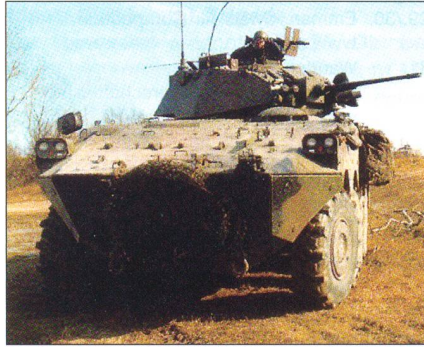
Schützenpanzer Centauro (I)

Die italienischen Streitkräfte haben mit der Beschaffung der (Kampf-)Schützenpanzerversion des Centauro-Panzerjägers begonnen.