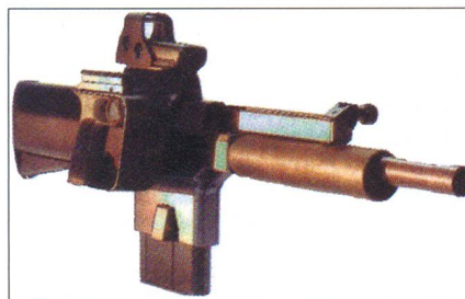
PAW 20 (SA)

Die südafrikanische Rüstungsunternehmung hat die völlig neuartige Infanteriewaffe unter der Bezeichnung PAW20 (Personal Assault Weapon 20x42 mm) vorgestellt, welche zusammen mit Denel entwickelt wurde.