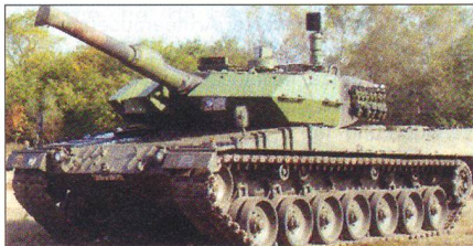
Leopard 2A5 mit EADS MUSS (D).

Das MUSS bietet für seine Plattform einen hohen Schutz gegen sämtliche Bedrohungen auf dem Gefechtsfeld, inklusive Panzerabwehrlektro- waffen.