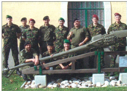
Der UOV Glatt- und Wehntal mit Kameraden des UOV Niederösterreich in Melk.

Der militärische Festakt stand unter dem Motto: «Gestern – Heute – Morgen». Einmarsch der Ehrenformation, Begrüssung, Interview von Zeitzeugen, militärischer Vorbeimarsch mit historischen Fahrzeugen war der Ablauf des militärischen Festaktes. Zum Abschluss der Feierlichkeiten wurden wir zu einem köstlichen Nachtessen im Stadthaus eingeladen. In einer kleinen Bar liessen wir den Tag zusammen mit unseren «Reiseführern» ausklingen.