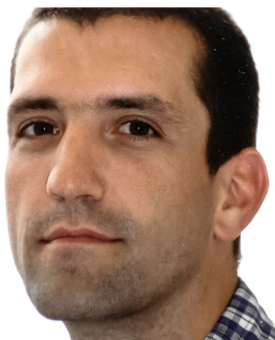
Fahnder Hert: Anders als im Krimi.

Die Polizeifusion ändert an der politischen Kompetenzverteilung nichts. Die Gemeinden sind weiterhin für die Sicherheit verantwortlich, müssen aber die entsprechenden Leistungen künftig bei der Kantonspolizei einkaufen. slg.