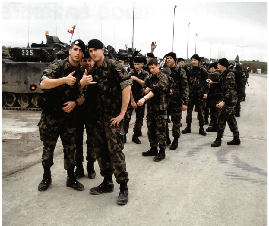
Immer gut gelaunt.

Vom Serienfeuer mit vier Panzern gleichzeitig, Durchhalteübung, über Häuserkampf bis zu einer Bataillonsübung stand alles auf dem Programm. Mit unserem zweiten 50-km-Marsch in Bure, zusammen mit unseren Soldaten, ging unsere «Militärzeit»