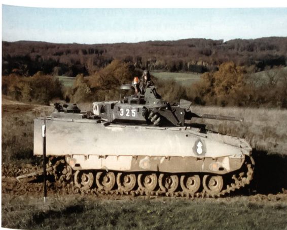
Schützenpanzer im Gelände