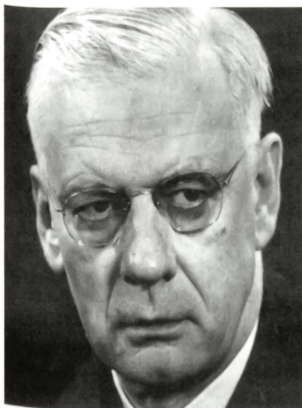
Markus Feldmann, 1897–1958.

Im Oktober lässt der Bundesrat erstmals die Katze etwas grosszügiger aus dem Sack. Danach sei er ungefähr Mitte 1956 – er nennt die Informanten nicht – vor Beziehungen des damaligen Bundesanwalts René Dubois zum Vertreter des französischen Geheimdienstes in der