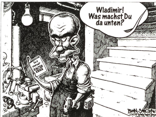
Putin im Keller.