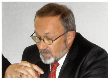
Regierungsrat Beat Fuchs: «Kompetente, kundenfreundliche Dienstleistungen.»