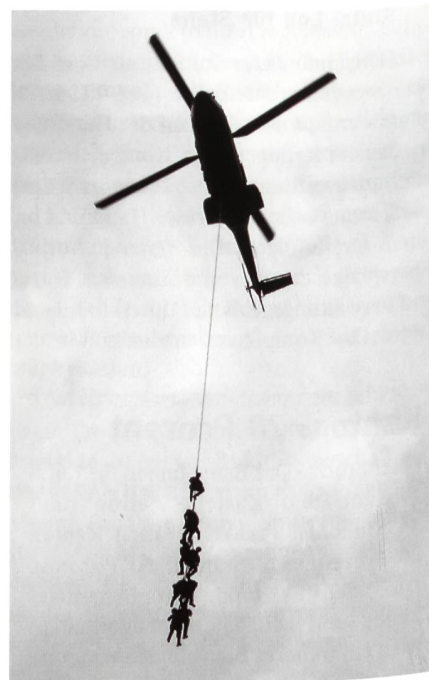
Einsatz in der Luft.