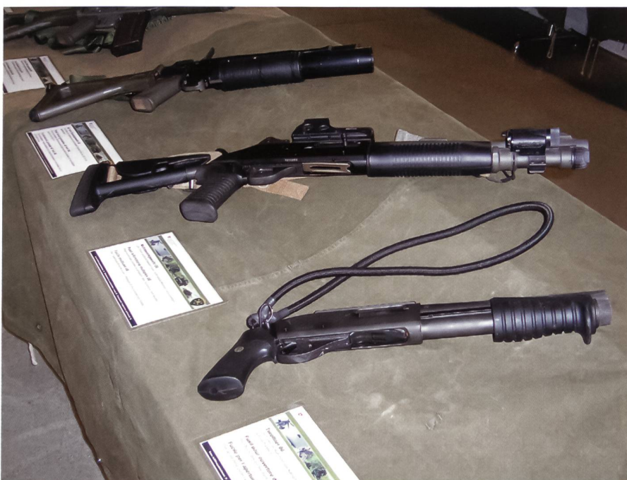
Türöffner 06, Mehrzweckgewehr 06 und im Hintergrund das GLG 40.

Ein Gesuch für den Einsatz ist an den Bundesrat zu richten, der darüber entscheidet. In seinem Auftrag sind u.a. die Zuständigkeiten, die Unterstellungsverhältnisse und der Einsatz der Mittel geregelt. Der Bundesrat legt ferner fest, welches Departement für die Operation zuständig ist.