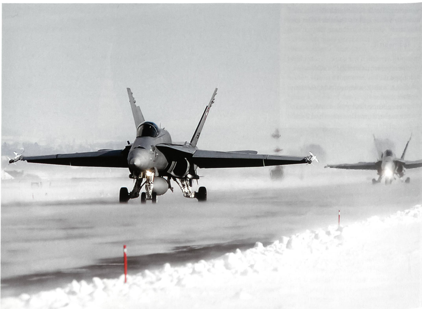
F/A-18 im WEF-Einsatz.

Zugegeben, die Arbeit als Referent Verteidigung beim Chef VBS hat nicht immer einen so direkten Bezug zu meinem Ursprungsmetier Luftverteidigung. Aber faszinierend und den Horizont erweiternd ist sie trotzdem in vielerlei Hinsicht.