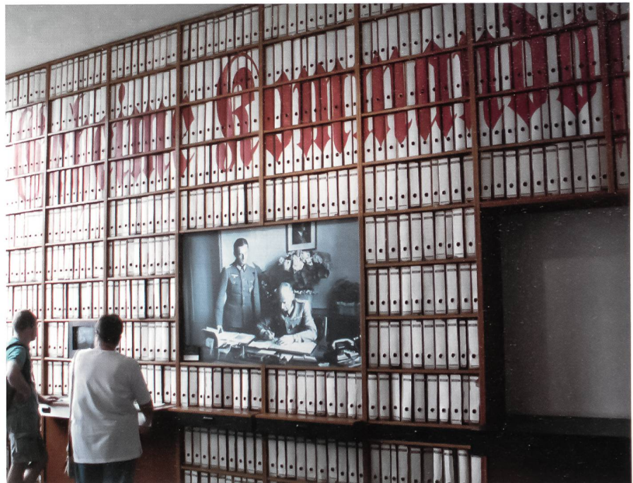
Im Kraftwerkbau des Museums ist auch diese Dokumentationsstelle des für die Entwicklung der V2 verantwortlichen militärischen Chefs, General Walter Dornberger, zu besichtigen. Der Schriftzug «Geheime Kommandosache» ist über der riesigen Front der Ordner zu lesen.

Eine umfassende Begehung ausserhalb des Museumsgeländes mit Besichtigung von Überresten der Abschussanlagen kann in diesem Nordteil Usedom nur mittels spezieller Führungen gemacht werden.