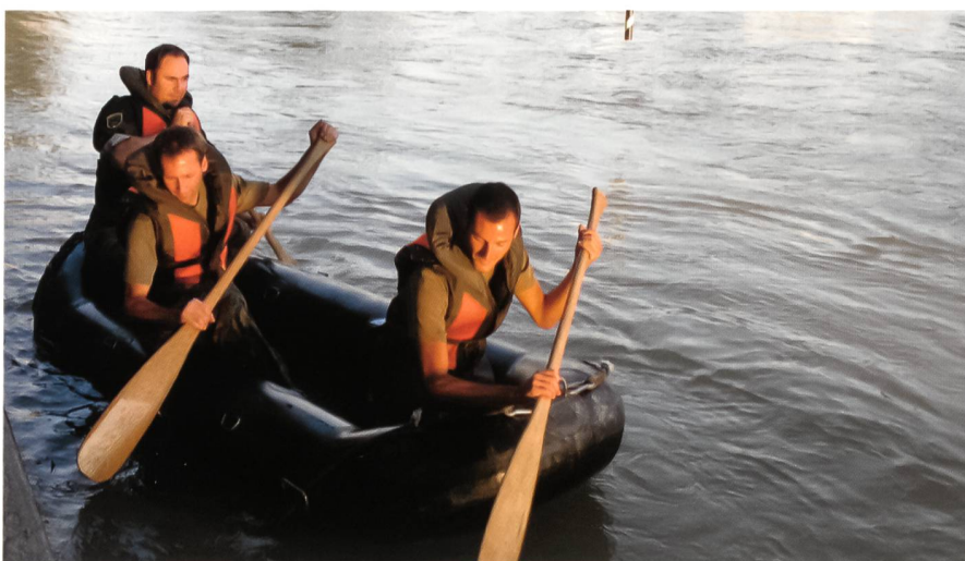
Spannender Wettkampf im Schlauchboot.

Dank der grossartigen Unterstützung der Verantwortlichen des Wpl Bremgarten konnte der SUOV seinen Wettkämpfern optimale Trainingsbedingungen vorgeben und auf gute Resultate zählen.