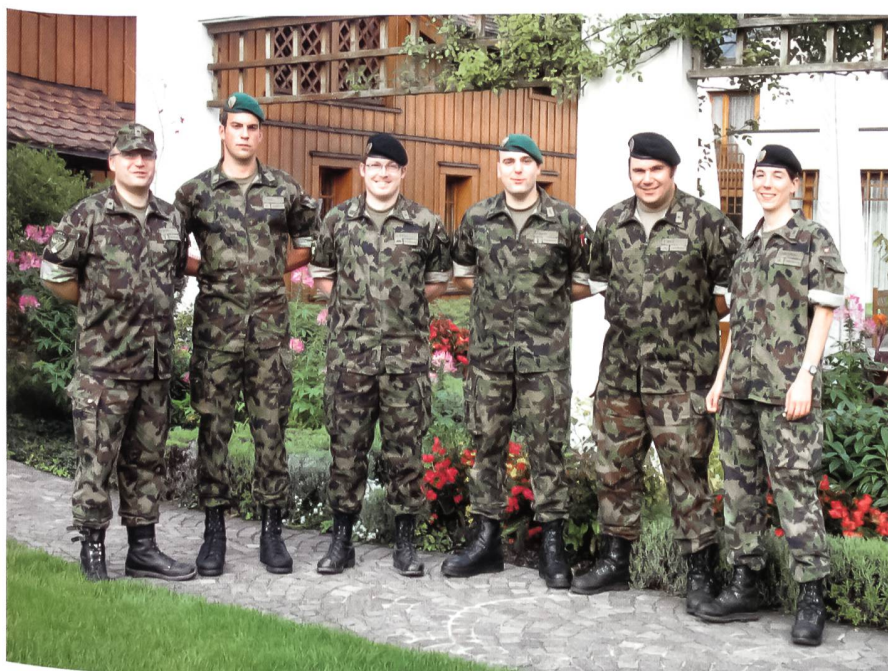
Das OK Schweizerische Unteroffizierstage 2010 im Lilienberg.

«Ich mache im UOV mit, weil ich hier immer wieder Neues über die Schweizer Armee lernen kann. Wir erhalten im UOV Einblick in andere Truppengattungen, können uns zwischen Uof und Of austauschen und pflegen eine gute Kameradschaft. Als besondere Highlights in unserem Vereinsleben betrachte ich die U Walenberg vom 9. Juni 2007, die Weiterentwicklungen unserer UOV-Übungen und das Mitmachen im Vorstand.»