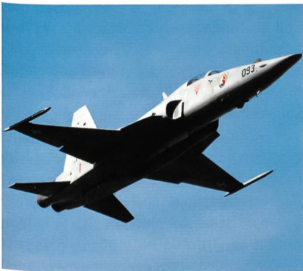
Payerne: Noch 11000 Flugbewegungen.

Parallel dazu haben die mit dem Lärm-schutz betrauten Dienststellen der Kantone Freiburg und Waadt eine Richtlinie für die Raumplanung erlassen. All dies wird sich