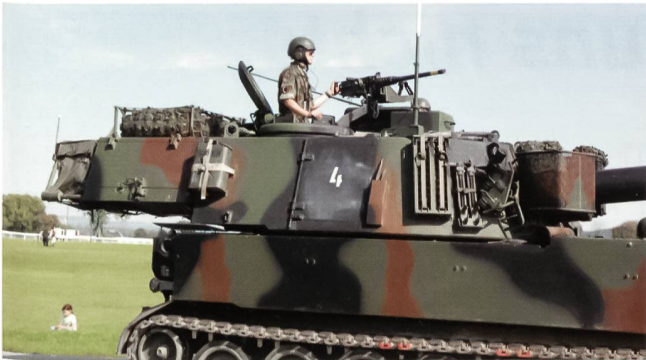
Moderne Artillerie: Die Panzerhaubitze M-109.