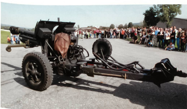
Die Haubitze 10,5 cm – ein leichtes, hochbewegliches Geschütz, das lange gute Dienste versah.