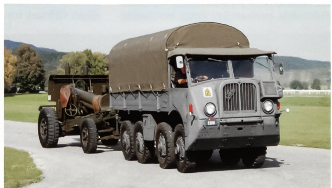
Der Saurer M-8, das Zugfahrzeug der Schwere Kanone – einst wohl beste Zugmaschine der gezogenen Schweizer Artillerie.