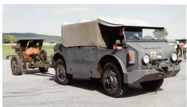
Der M-4 «Heckferrari» – das Zugfahrzeug der Haubitze 10,5 cm – für die Kanoniere eine «windige» Sache.