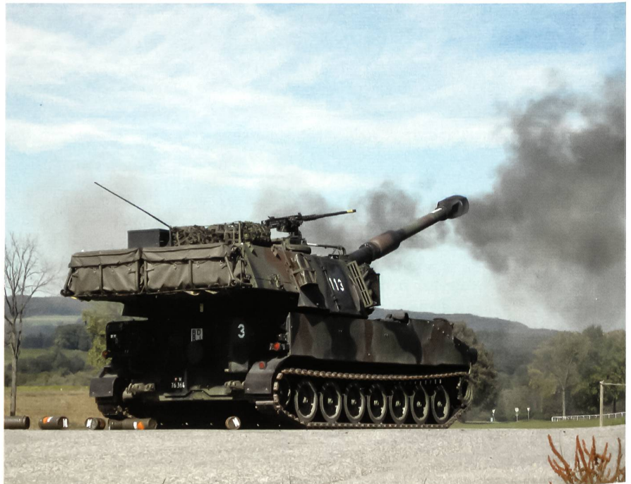
22. September 2007, 14.32 Uhr, Geschütz Nummer 3: Der letzte Rekruten-Schuss.

Nach dem technischen Schiessen bekämpfte die Batterie gegnerische Infanterie im Zielhang. Um 14.28 Uhr befahl der Schiesskommandant ein letztes Mal