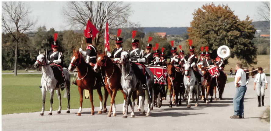
Hoch zu Ross zum abschliessenden Vorbeimarsch. Noch einmal lebte am 22. September 2007 die lange Tradition des Schweizer Wehrwesens und des Waffenplatzes Frauenefeld auf.