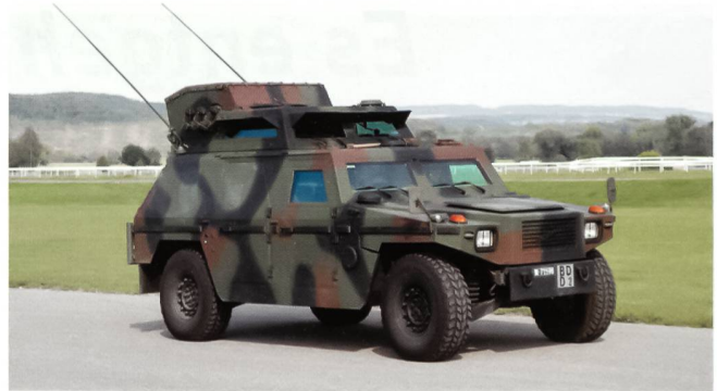
Der Schiesskommandant bezieht Stellung.