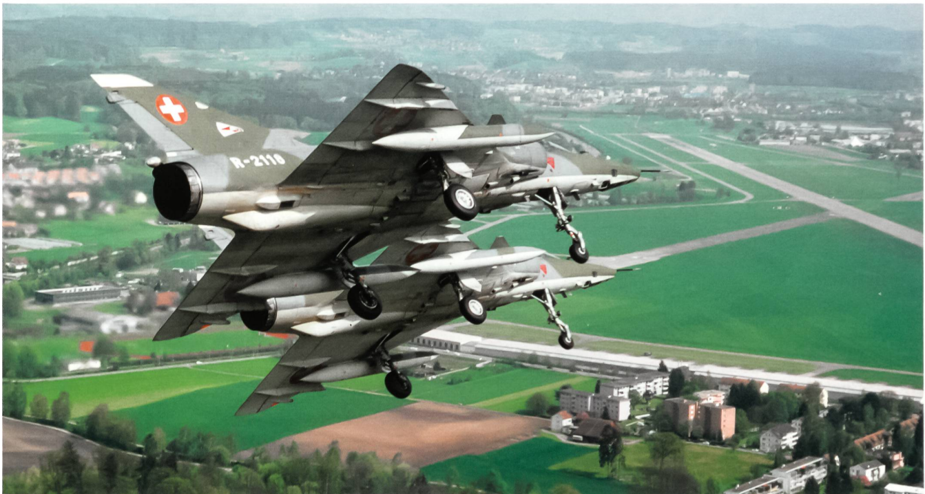
Patrouille Mirage IIIRS im Landeanflug auf die Home Base Dübendorf.

einzuordnen, und waren gezwungen, die englische Voice zu beherrschen.