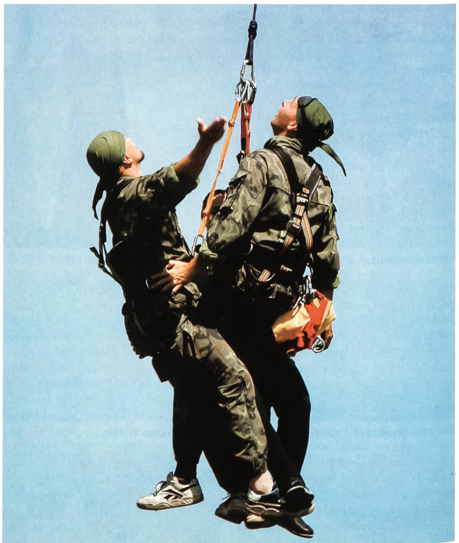
Höchstleistungen bleiben gefordert.

Dies erfordert die Beorderung von zumindest 30 Jahrgängen, also aller 20- bis 50-Jährigen für die gesamte Zeitspanne. Daher müssen diese Wehrpflichtigen (und nur über die «Pflicht» ist dies möglich) in dieser Zeit «beübt» werden, um ihre militärischen Fähigkeiten zu erhalten und neue Taktiken und Techniken übernehmen zu können. Dies wiederum macht es notwendig, eine relativ kurze «Anlernphase» einer längeren,