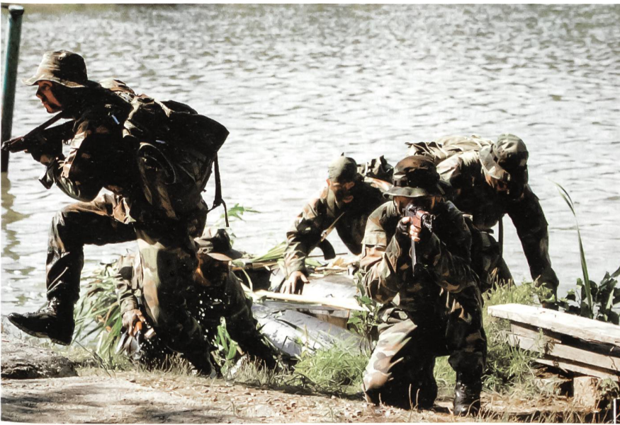
Die Anforderungen des Gefechts.

änderungen zumindest behindert wird. Auch Berufsmilitärs sind in einer Demokratie Träger demokratischen Gedankenguts und Garanten für die Erhaltung desselben. So hat England traditionell eine Berufsarmee, deren quantitative «Aufstockung» durch Wehrpflicht erst in nationalen Notfällen erfolgte.