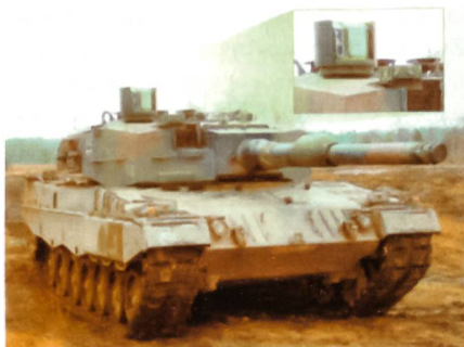
Erprobungsträger Leopard 2 mit AZEV.

Die deutschen Streitkräfte haben erste Versuche mit dem neuartigen AZEV (Automatische Zielerfassung und Verfolgung) des Herstellers Rheinmetall Defence Electronics abgeschlossen. Beim Prototyp, welcher zu Versuchszwecken in einem Leopard 2A4 eingebaut wurde, handelt es sich um ein Beobachtungsmittel für gepanzerte Fahrzeuge,