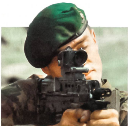
Britisches Sturmgewehr SA80A2.

Die britischen Streitkräfte haben den Bedarf an einer weiteren Überarbeitung ihrer Sturmgewehre vom Typ SA80A2 respektive