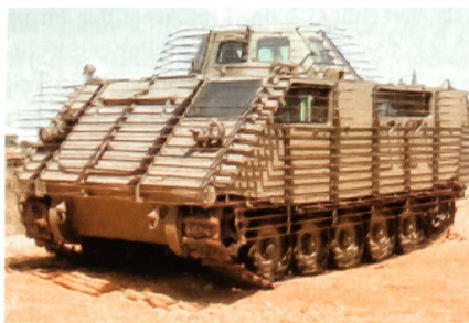
Umgebauter M113 «Urban Fighter».

Der israelische Rüstungskonzern IMI hat die Entwicklungsarbeiten am so genannten Urban Fighter («Stadt-Kämpfer») abgeschlossen. Es handelt sich hierbei um umgebaute Schützenpanzer des Typs M113 mit erheblich verbessertem Panzerschutz. Der Urban Fighter verfügt über eine Hybrid-Panzerung (Passiv/Reaktiv) welche Schutz