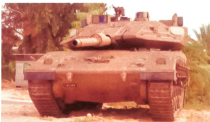
Kampfpanzer Merkava 4 mit Trophy-Schutzsystem.

Die israelischen Streitkräfte haben bekanntgegeben, dass künftig alle Kampf- und Schützenpanzer mit dem aktiven Selbstschutzsystem «Trophy» ausgestattet werden sollen. «Trophy» ist in den Lage, sowohl gelenkte Panzerabwehrflugkörper