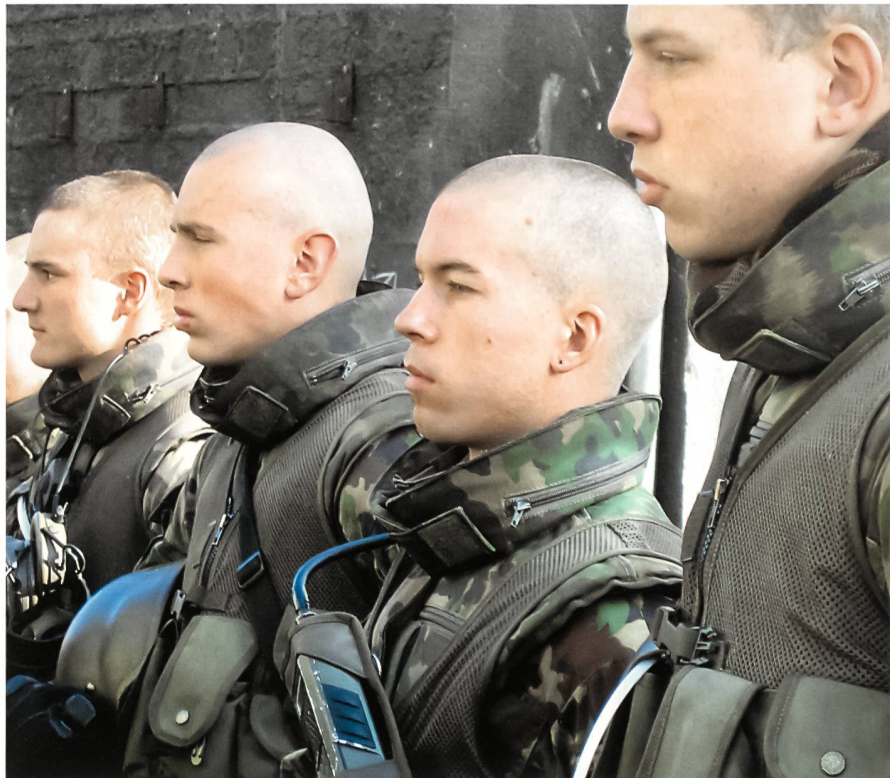
Militärpolizeigrenadiere nach dem Häuserkampf in der Zivilschutzanlage Andelfingen.

Wie Brigadier Staffelbach am 31. Oktober 2007 im Zivilschutzzentrum Andelfingen hervorhob, stellt die Raumsicherung eine recht schwierige Operationsform dar. Die zivilen Instanzen behalten die Einsatzverantwortung; der militärische Kommandant trägt die Führungsverantwortung. In