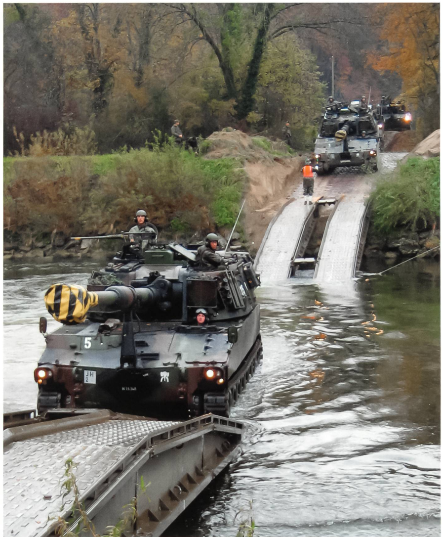
Panzerhaubitzen M-109 der Artillerieabteilung 10 durchqueren die Thur bei Alten über eine Furt, die eine Kompanie des Panzersappeurbataillons 4 erstellt hatte.

«Stellt die Führungsfähigkeit der Brigade im gesamten Einsatzraum sicher.»