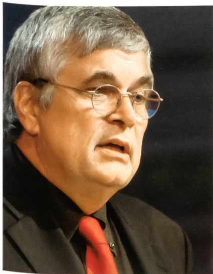
Kriegsberichterstatter Ulrich Tilgner.