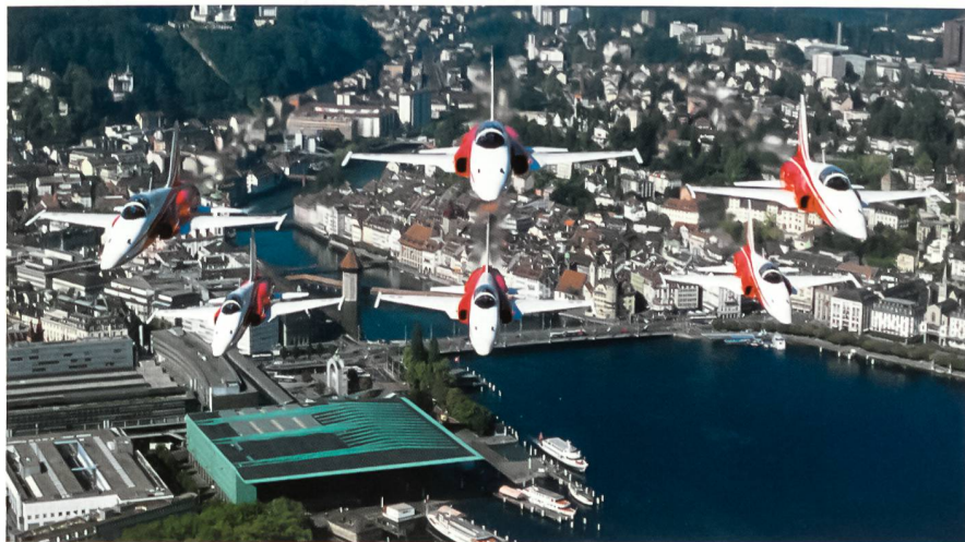
Die Patrouille Suisse im «Doppelpfeil» über dem Luzerner Seebecken.

Der vorliegende Text von Daniel Stämpfli stammt aus dem neuen Buch: Das Überwachungsgeschwader 1992 bis 2005. Die letzten 14 Jahre der traditionellen Berufsformation der Luftwaffe. Herausgegeben von Hanspeter Ruckli, Adrian Urscheler, Matthias Kalt. Das Werk vereinigt spannende Texte und grandiose Bilder. Es kann bezogen werden im Baden-Verlag, 5405 Baden-Dättwil. www.baden-verlag.ch