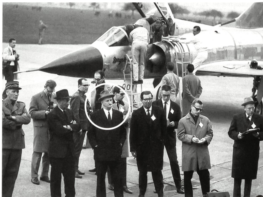
Bundesrat Paul Chaudet (vorne mit Hut und Schnauz) vor einem Mirage-Flugzeug. Führer: «Die Mirage-Affäre lässt den Schluss nicht zu, dass das Flugzeug gekauft worden ist, um im Kriegsfall mit den Franzosen oder mit der NATO zu kooperieren.»

Der Bundesrat war nach längerer Diskussion bereit, in der Waffenstillstandsmission für Korea zusammen mit Schweden «neutrale» Vertreter des westlichen Bünd-