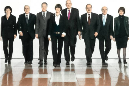
Bundesrat mit Bundeskanzlerin.

Der SiA besteht aus dem Chef des VBS, der Chefin des EDA und dem Vorsteher des EJPD. Der Ausschuss koordiniert departe-