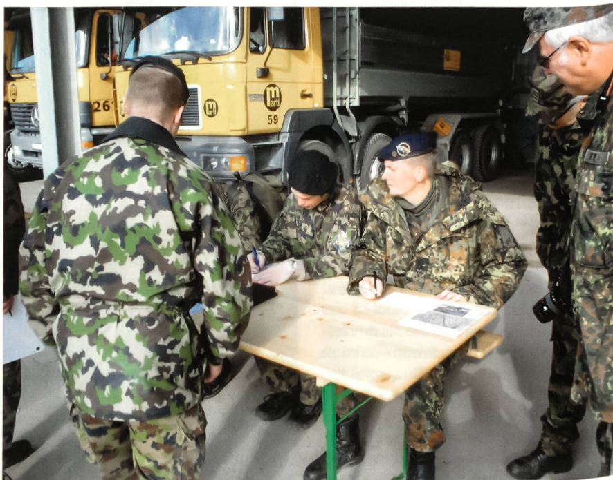
Meldung korrekt erstellen.

Dabei musste durch einen Feuerwehrschlauch und eine Eimerspritze möglichst viel Wasser transportiert werden, was den meisten Patrouillen auch sehr gut gelang.