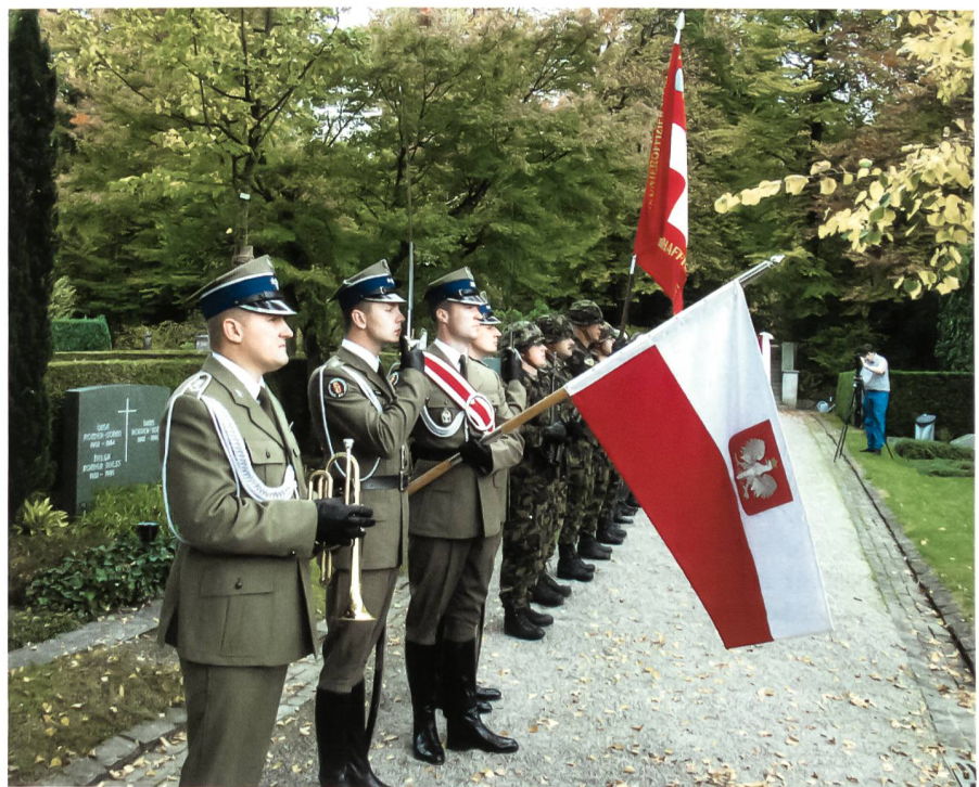
Ehrenbezeugung der polnischen Armee in Winterthur.