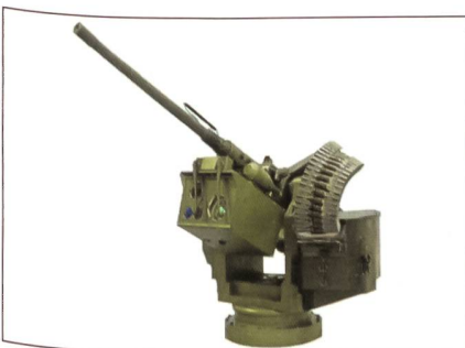
Trackfire RCWS mit schwerem MG.

Saab System hat mit dem neuvorgestellten Trackfire nun auch ein sehr konkurrenzfähiges Produkt im Bereich der fernbedienten Waffenstationen (RCWS). So verfügt das vollstabilisierte System über die Möglichkeit auch im Gelände während der Fahrt zu feuern und Ziele automatisch zu erfassen und gegebenenfalls entsprechend ihrer Bedrohung zu bekämpfen. Daneben kann das