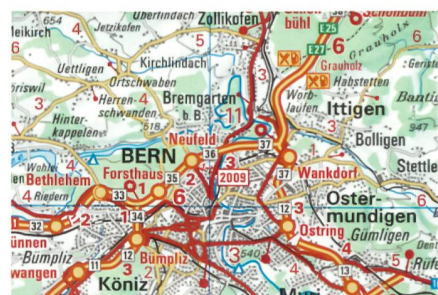
Strassenkarte 1:200 000.

Das Bundesamt für Landestopographie, Swisstopo, publiziert die aktualisierte Strassenkarte. Die Ausgabe 2008-2009 bleibt seinen zwei Formaten treu: eine Karte, Vor- und Rückseite bedruckt, oder