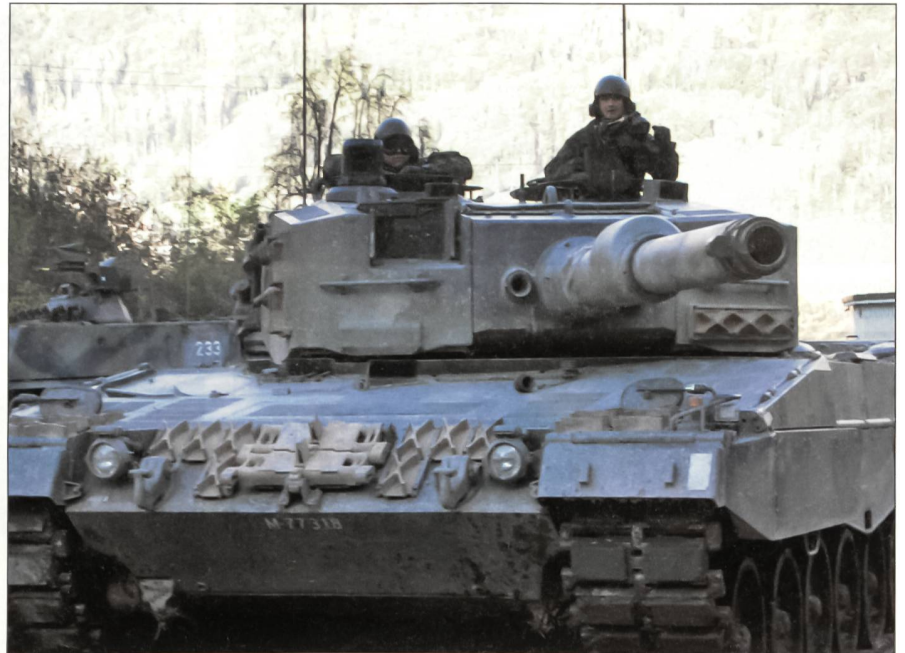
Panzertruppen – gut gerüstet.

Er hat ohne zu erröten festgestellt: «Mit dem Entlastungsprogramm 04 geht eine namhafte Unterschreitung der finanziellen Schwelle der für die Umsetzung der Armee XXI notwendigen 4 Milliarden ein-