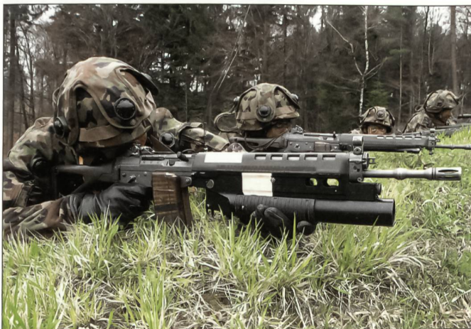
Infanterie – gut ausgebildet.