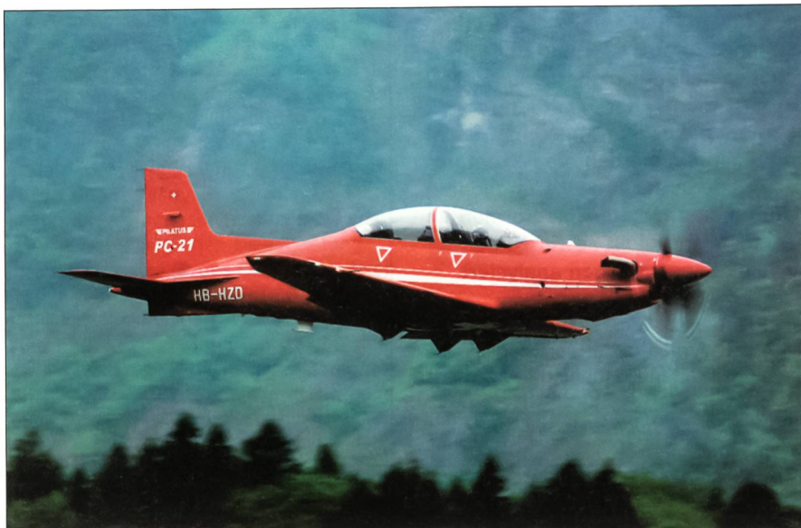
Mit dem Rüstungsprogramm bewilligt: der PC-21.

Die teuerste Position im Rüstungsprogramm 2006 bildet mit 424 Millionen Franken die erste Tranche des Führungsinfor-