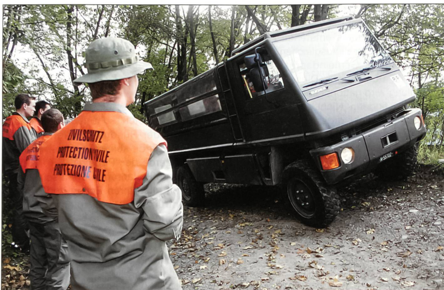
Fahrtraining in schwierigem Gelände.