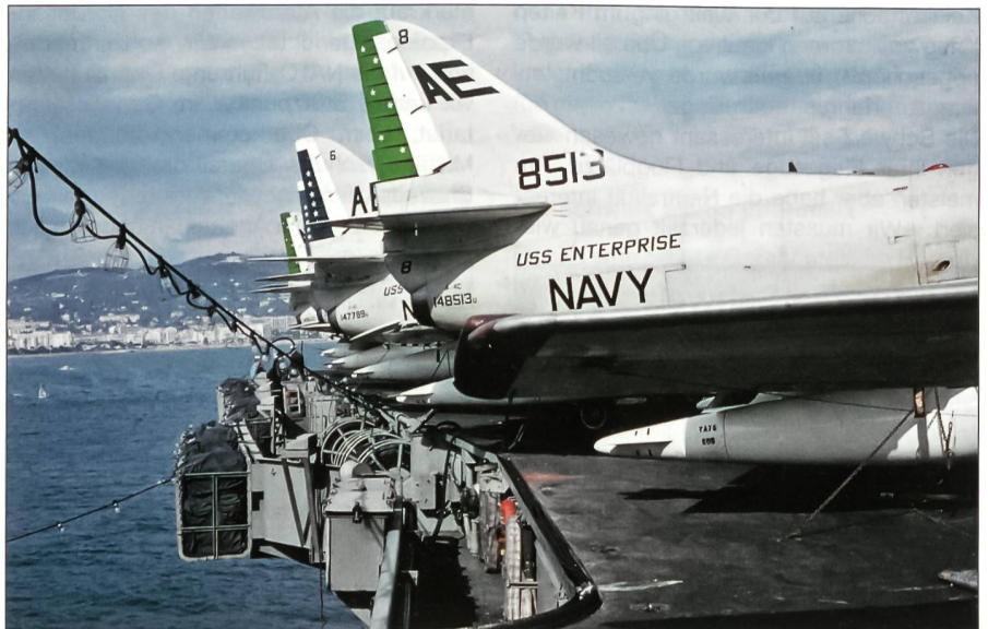
In den 60er-Jahren führte die USS Enterprise drei Staffeln A-4C-Skyhawk-Jagdbomber mit. Hier sind Maschinen von zwei Staffeln (vorne eine A-4C der Attack Squadron VA-76 und hinten solche der Attack Squadron VA-66) auf dem Achterdeck des Trägers parkiert. Im Hintergrund Cannes.

1965 wechselte die USS Enterprise ihren Heimatstützpunkt von Norfolk in den Pazifik. In den Jahren 1965 bis 1972 fuhr sie sechs Mal für jeweils viele Monate in die Gewässer vor Vietnam; erstmals flogen ihre