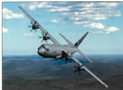
C-130 der USAF.

Seit mehr als 50 Jahren wird die Hercules produziert und ist damit ein Teil der grossen Flugzeuggeschichte geworden. Heute ist die C-130 Super