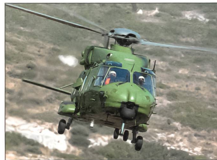
Auch für Griechenland: NH-90.

Die ersten Hubschrauber vom Typ NH-90 für die griechischen Streitkräfte stehen vor der Auslieferung. Insgesamt werden 20 NH-90-Helikopter zuzüglich 14 als Option für Griechenlands Heer gefertigt. Von den 20 Maschinen sind 16 in der Version als taktischer Transporthubschrauber und vier für Spezialeinsätze konfigurierte Helikopter