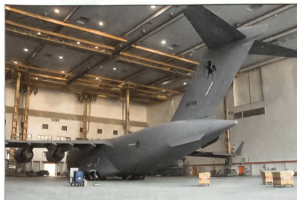
Die erste australische C-17.

Die Royal Australian Air Force (RAAF) wird vier strategische Lufttransporter C-17 Globemaster III (Block 17) erhalten. Die erste C-17-Transportmaschine für die RAAF absolvierte Ende Oktober ihren Jungfernflug und wurde am 28. No-