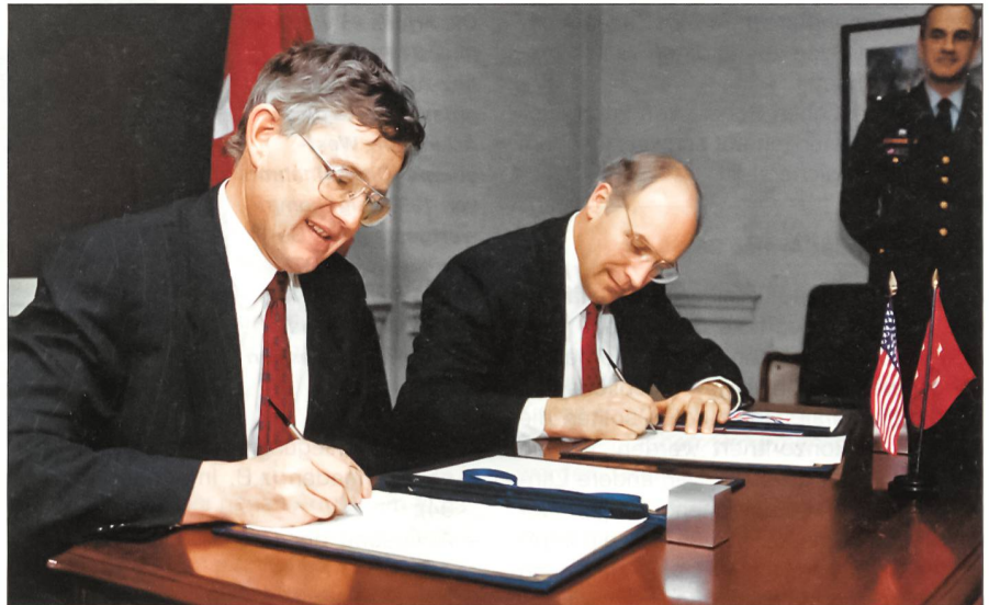
Der politische Vater der Armeereform 95 war Bundesrat Kaspar Villiger. Die Aufnahme zeigt ihn anlässlich eines Besuches im Pentagon im März 1990 bei der Unterschrift eines Memorandum of Understanding zusammen mit dem damaligen Verteidigungsminister und heutigen Vizepräsidenten Dick Cheney.

Die neue Armee sollte dem neuen Umfeld, aber auch dem Empfinden der Schweizer Bevölkerung Rechnung tragen. Vor allem zeigten die Risikoanalysen, die übrigens eine erstaunliche Ähnlichkeit zum heutigen Bedrohungsbild aufweisen, dass der Armeeauftrag erweitert werden musste. So sahen die Aufträge neu eine Dreiteilung vor, nämlich den Hauptauftrag «Kriegsverhinderung und Verteidigung» sowie die Zusatzaufträge «Allgemeine Existenzsiche-