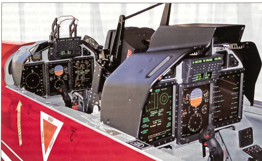
Der PC-21 ist ein Doppelsitzer. Das Kernstück bildet das neue digitale Cockpit. Die multifunktionalen Bildschirme sind jenen eines modernen Kampfflugzeuges nachgebildet.