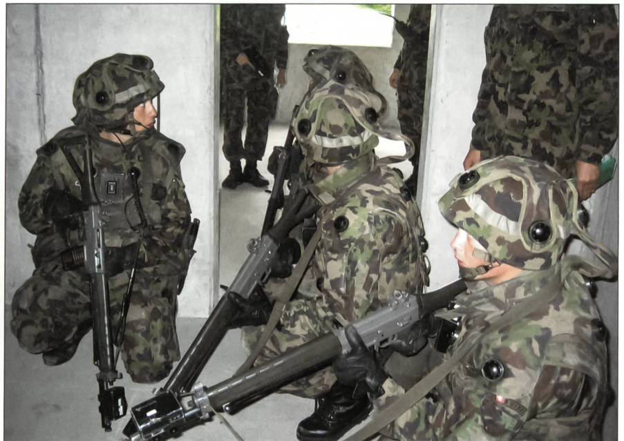
Häuserkampf in Anschwilten.

Jede Neuorganisation bringt Änderungen mit sich, neben den Risiken beinhaltet sie