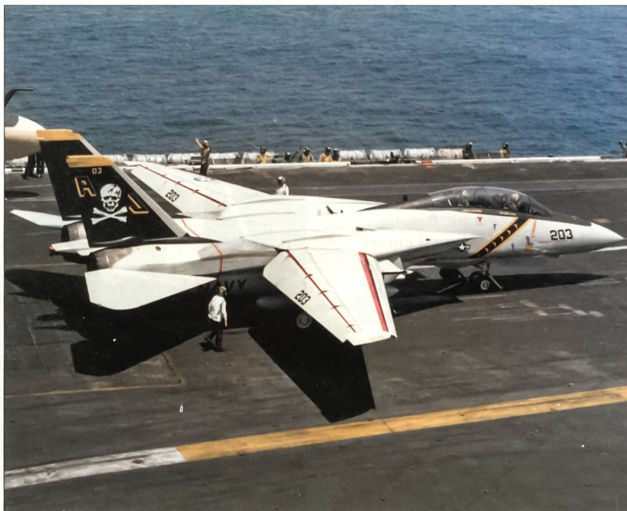
Eine F-14A der Fighter-Squadron 84 wird zum Katapultstart vom Flugzeugträger USS Nimitz (CVN 68) vor der Küste Virginias vorbereitet. Links hinten ist eine KA-6D Intruder-Betankungsmaschine erkennbar.

Diese 22 Maschinen F-14D der Fighter-Squadron 31 (Tomcatters) und der Fighter-Squadron 213 (Blacklions) wurden dann am 10. März 2006, einen Tag bevor der Träger nach Norfolk zurückkehrte, von Bord katapultiert; die letzte F-14 mit der Kennziffer 112 gehörte der VF-31 an. Der Kommandant des Marineflieger-Geschwaders 8, Kapitän zur See Bill Sizemore, hatte es sich nicht nehmen lassen, an diesem Tage selber auch noch eine der Maschinen zu