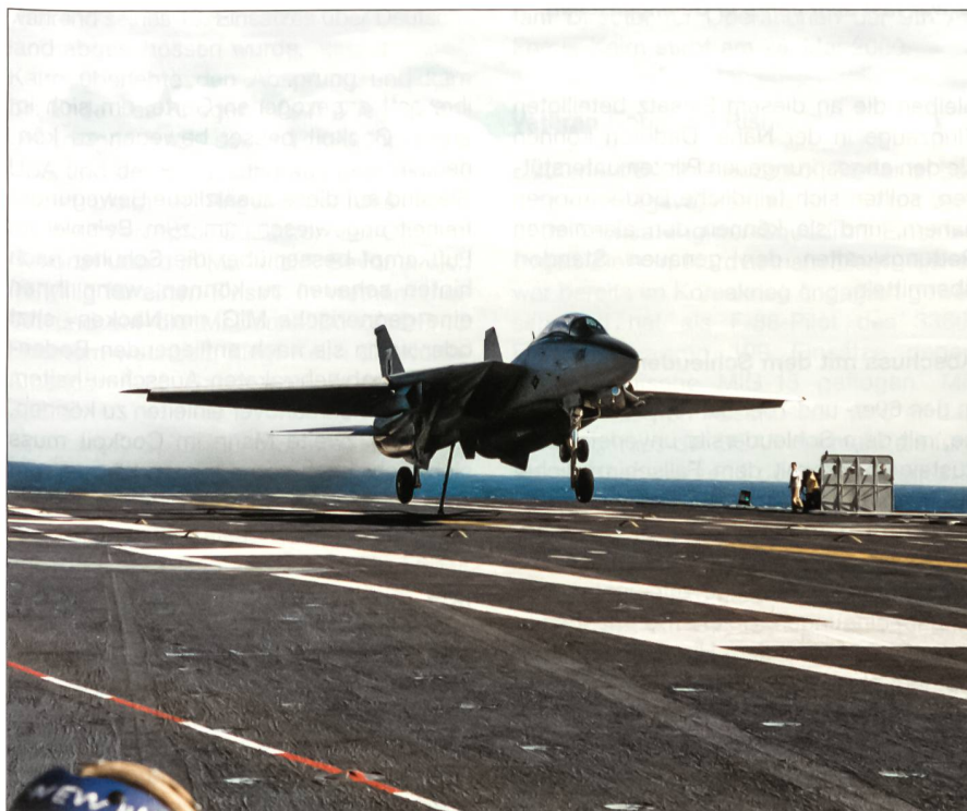
Eine F-14 der Fighter-Squadron VF-41 greift ein Fangseil bei der Landung auf der USS Theodore Roosevelt (CVN-71) vor der Küste Virginias anlässlich von Flugoperationen im Oktober 1995.